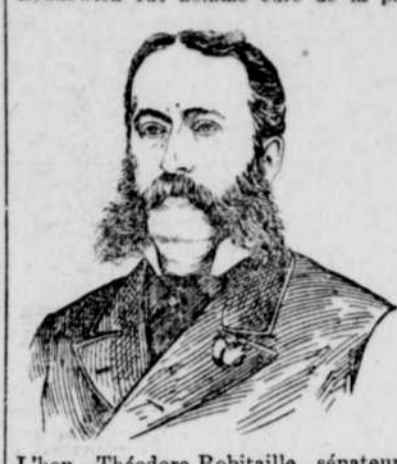
L'hon. Théodore Robitaille, sénateur, ancien lieutenant-gouverneur de la province de Québec.

Un individu a été fusillé pour avoir violé des provisions.