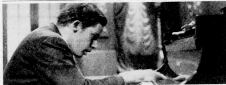
Glenn Gould interprétera une Sonate et une Fantaisie et fugue de Mozart, "En blanc et noir", lundi soir à 7 h. 30.