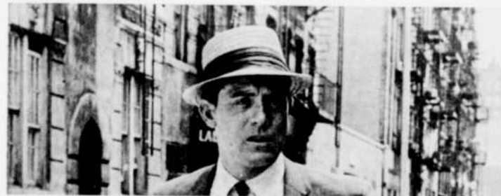
A 8 h. 30, "La Cité sans voiles" pose une nouvelle énigme à la police.