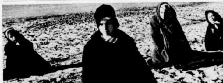
Vendredi soir 11 h. 30: "Les Sorcières de Salem", drame de la superstition.

"Heureuse époque", film à sketches d'Alessandro Blasetti, avec Aldo Fabrizi, Gina Lollobrigida et Vittorio de Sica.