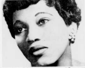
Leontyne Price chantera au "Concert" de samedi à 8 heures.