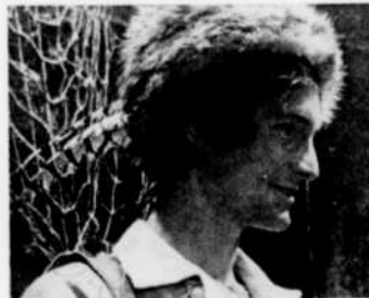
"Ti-Jean Caribou", le vendredi à 5 heures.