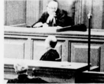
Le mardi soir à 9 heures, "La Cour est ouverte".