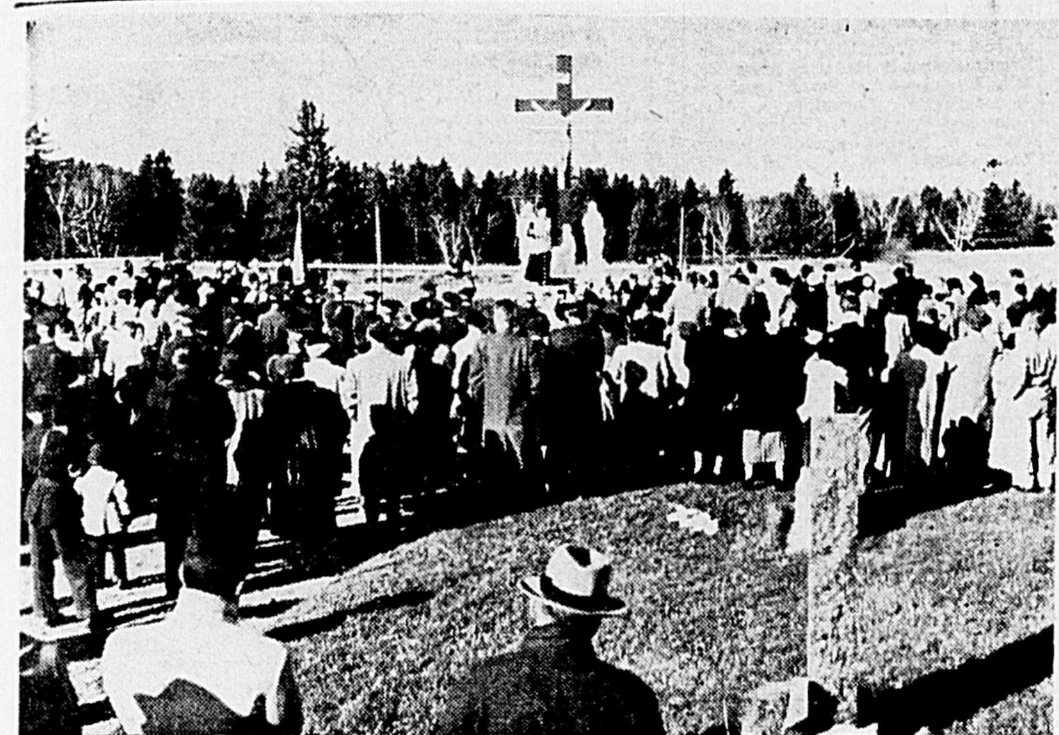
LA CEREMONIE ANNUELLE AUX MORTS a eu lieu dimanche à Arvida. Elle était organisée par les Chevaliers de Colomb de la ville. On voit ici une partie de la foule autour de la grande croix du cimetière.