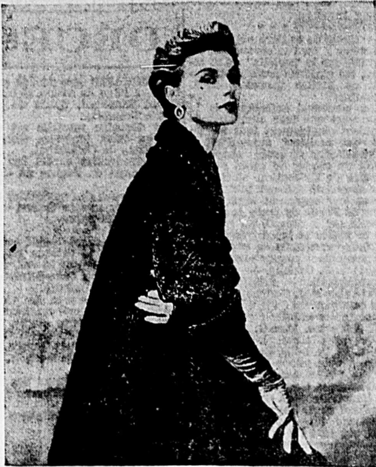
MOUTONS DE PERSE La popularité de la ligne "A" ne semble pas perdre de charme auprès des dames comme le prouve ce modèle de manteau. Il a été réalisé en un mouton de perse noir avec collet de velours et de perles.

Ces jolis minois accrochés à un bouton cousu sur le tablier, vous serviront de poignées. Patron 7010. Si vous désirez recevoir ce patron vous n'avez qu'à faire parvenir la somme de VINGT-CINQ SOUS (25c) en argent, avec votre nom, votre adresse, le no. du patron à: LE PROGRES DU SAGUENAY, 316 ave. Labrecque, Chicoutimi.