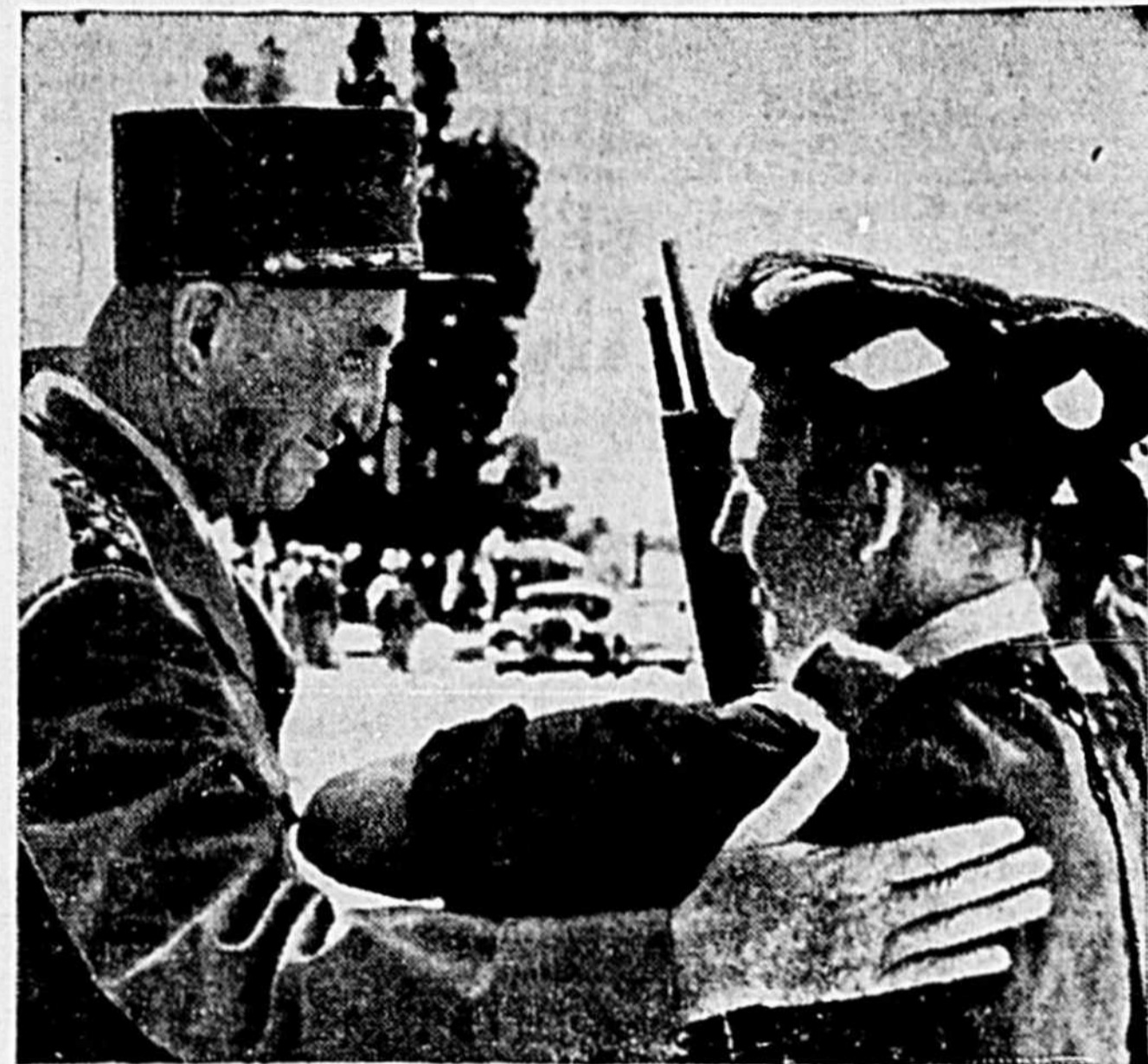
Le général Pierre Boyer de la Tour, résident général de France au Maroc, félicite ici un soldat des troupes marocaines qui ont beaucoup aidé à mater la rébellion des Berbères.

que cette entrevue sera suivie en moins de 24 heures d'une réunion du conseil, qui invitera probablement Ben Slimane, un nationaliste modéré, à former le premier gouvernement entièrement marocain. Ces événements aideront peut-être le président du Conseil, M. Edgar Faure, à écarter la menace contre la vie de son gouvernement, formé il y a huit mois. Mais personne ne veut prédire que les décisions de la fin de semaine suffiront à sauver le gouvernement à l'Assemblée nationale.