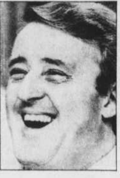
Voir page 8: Révolution

Les premiers gestes et les premières déclarations du gouvernement allaient rassurer à droite et faire craindre la pire à gauche. Ainsi on constata rapidement que les faucons occupaient les postes clés au gouvernement. La création d'un comité présidé par le vice-premier ministre, M. Erik Nielsen, un dur de dur, permit dès les premières semaines d'amorcer une révision de l'ensemble des programmes gouvernementaux afin de les élaguer. Puis un autre faucon, Sinclair Stevens, annonça la mise aux enchères de quelques so-