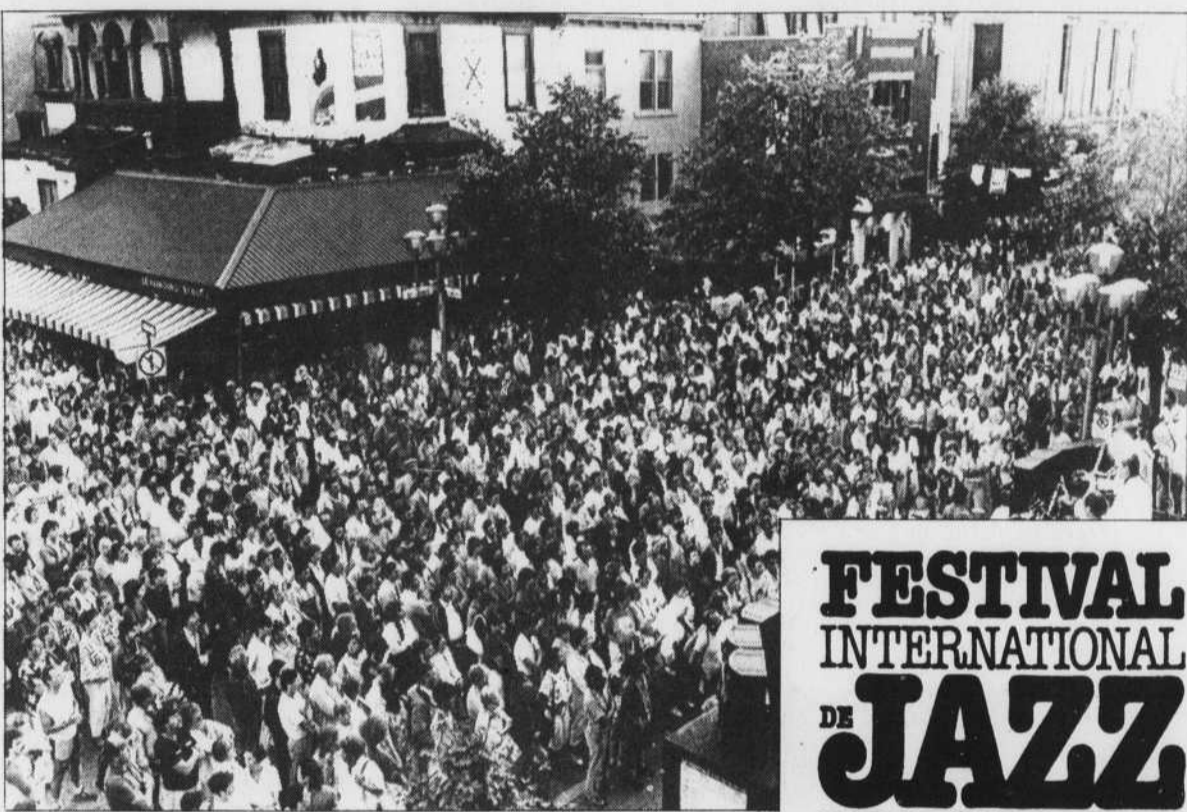
Grâce au beau temps qui règne sur la métropole, les amateurs de jazz sont nombreux à déambuler, rue St-Denis, au cœur même du Festival international de jazz, pour voir et entendre l'un ou l'autre des spectacles présentés sur les scènes extérieures.

Des fonctionnaires du ministère des Affaires étrangères ont rencontré hier des ambassadeurs arabes pour demander le soutien de leurs gouvernements, soulignant de source autorisée.