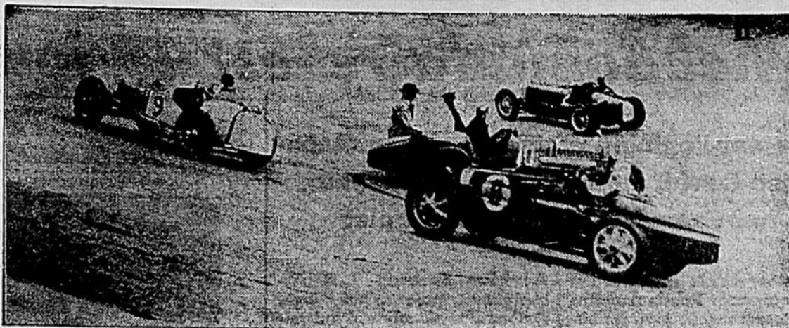
Sir Malcolm Campbell, détenteur du record de vitesse en automobile, a ayant fait 253 milles à l'heure, a évité une tragédie, sur la piste Brooklands, en Angleterre, dernièrement. On le voit ici au centre de la piste, juste au moment où ses concurrents doivent s'espacer pour laisser passer le bolide.

Vous donnent plus pour votre argent. Nouveaux modèles pour poêles et automatique. 309-311 rue St-Georges. 12 ans d'expérience.