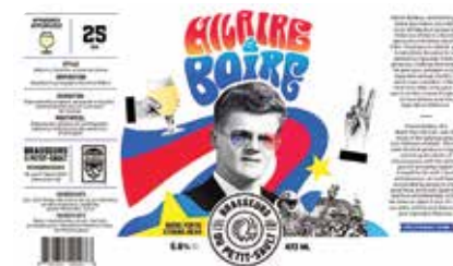
Les Brasseurs du Petit-Sault lancent une bière en l'honneur des Hôtesse d'Hilaire.

L'homme éprouvait un bonheur absolu à étirer l'élastique du ridicule, avec le but ultime de semer le rire partout où il passait. Faste et généreux, il adorait être entouré de gens pour partager un bon repas bien arrosé, rire fort et aimer sans