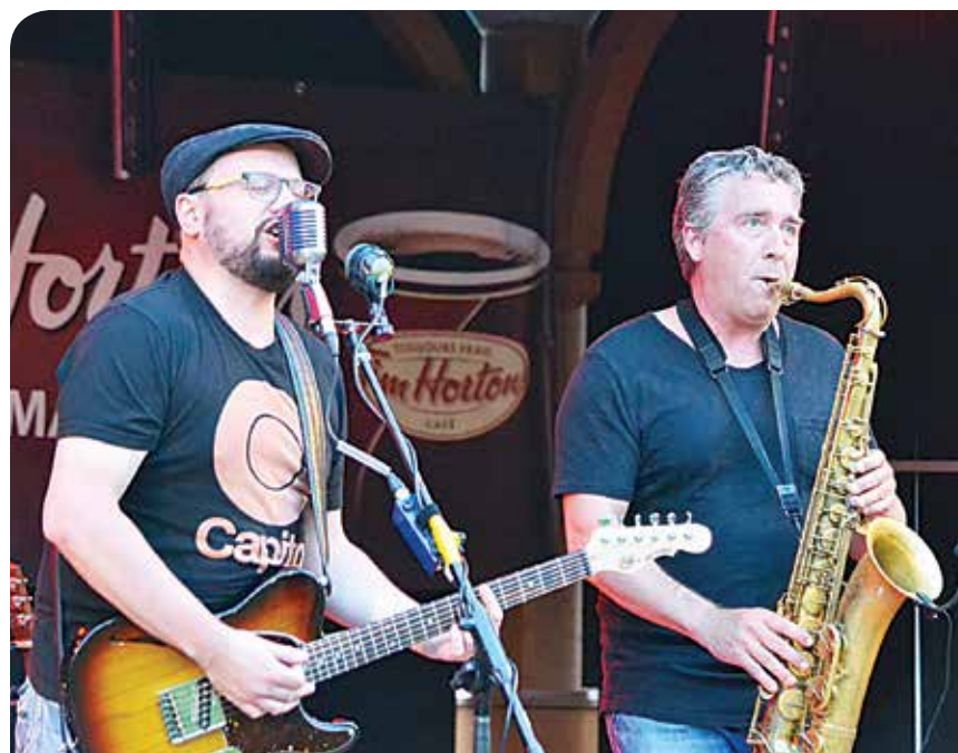
Les amateurs de musique jazz et blues seront heureux d'apprendre que le Festival de jazz et blues d'Edmundston sera de retour en 2022.

Pour ce qui est des laissez-passer, ils seront en vente à compter de la mi-mai, alors que la programmation complète sera dévoilée sous peu.