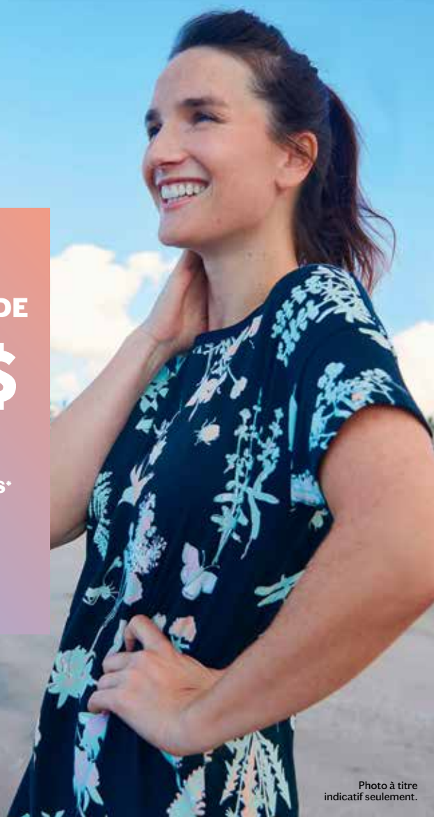
Photo à titre indicatif seulement.

†La carte promotionnelle est échangeable du 9 mai au 12 juin. *À notre prix étiqueté. Marques et modèles sélectionnés.