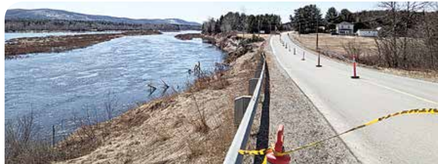
Un embâcle sur le fleuve Saint-Jean serait à l'origine d'un glissement de terrain.

table, ces gens devront probablement faire de l'enrochement afin d'éviter que ce scénario se répète tous les printemps», ajoute-t-il, en précisant que la route 205 est une route désignée provinciale.