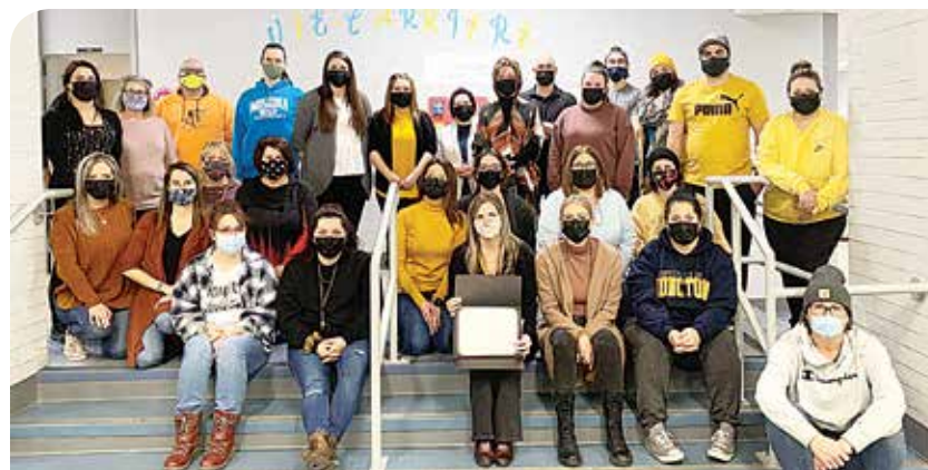
Sur cette photo, prise alors que les mesures sanitaires étaient en vigueur, on peut apercevoir le personnel enseignant de l'école Marie-Gaétane.

«Du jour au lendemain, les enseignants ont dû faire un 360 degrés. Ils ont dû apprendre à organiser des rencontres sur Zoom, à envoyer du matériel aux élèves, à enseigner aux enfants comment utiliser cette technologie avec laquelle ils n'étaient pas nécessairement familiers,