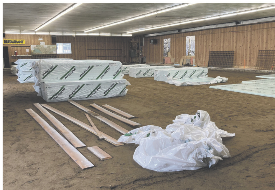
D'importants travaux sont en cours au Centre des loisirs de Grand-Saint-Esprit.