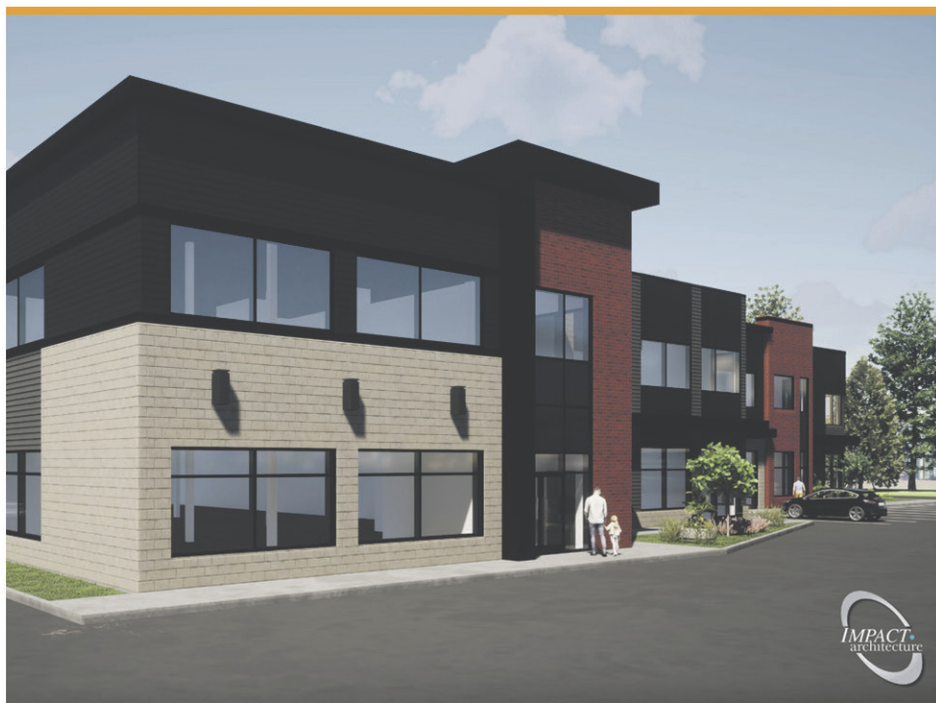
Façade extérieure du 1200 Port-Royal.