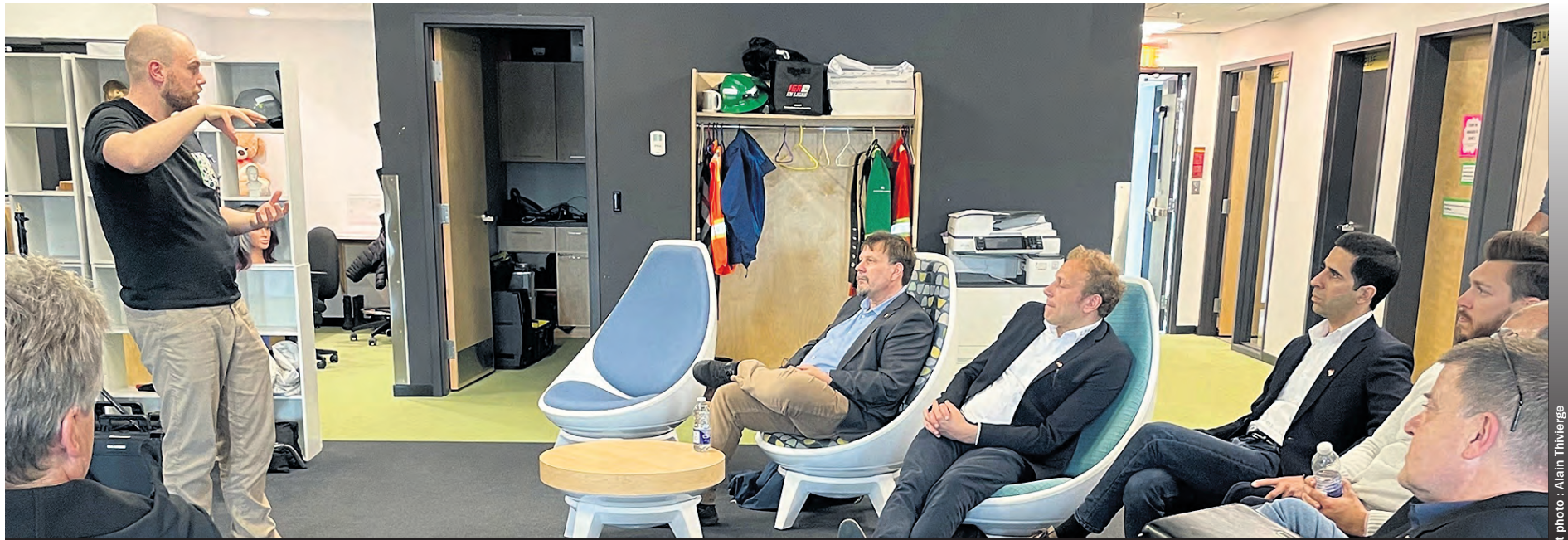
La délégation allemande a visité plusieurs entreprises liées au secteur de l'innovation minière à Val-d'Or et Rouyn-Noranda, les 1 er et 2 mai 2023.