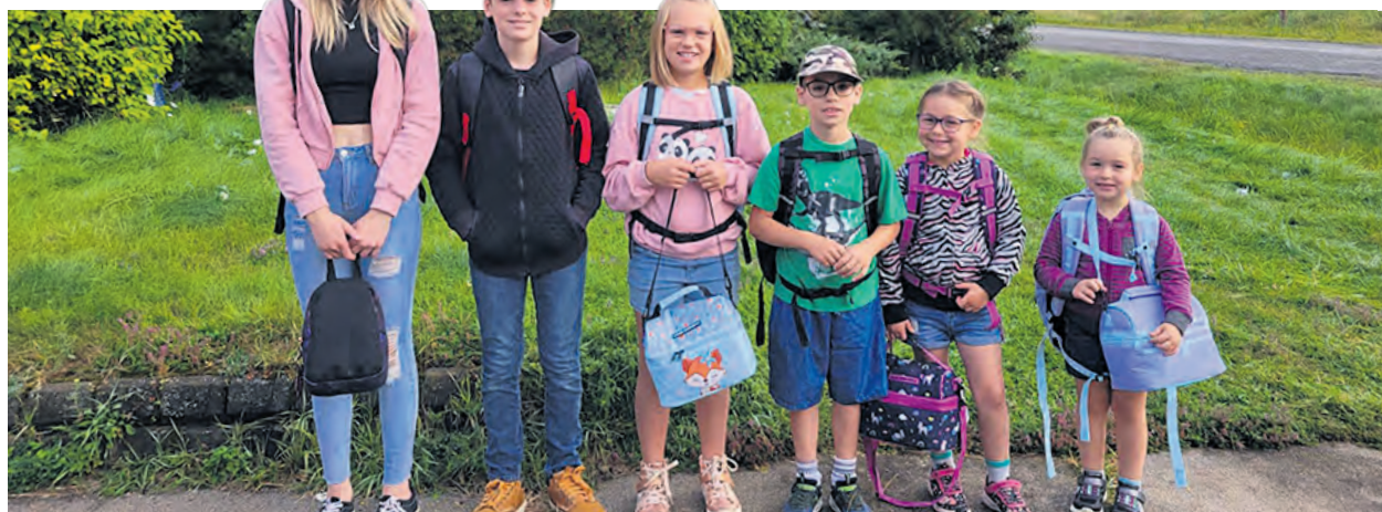
La fratrie à la rentrée scolaire.