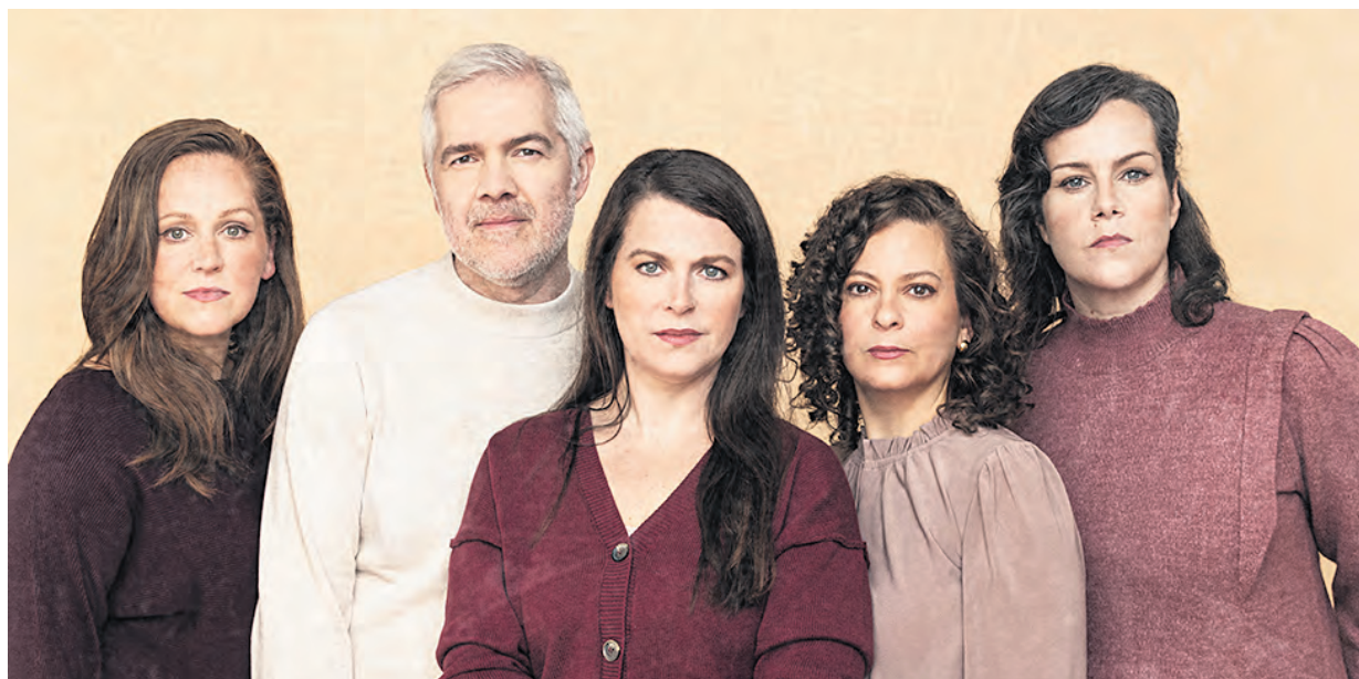
Le groupe WildWood Family.

Ce sont l'ambiance country-folk ainsi que les harmonies de voix présentes sur l'album qui distinguent et différencient le EP Au mois de mai. « On chante en harmonie à trois voix presque tout le temps, c'est peut-être plus quelque chose que l'on entend plus du côté anglophone, si je ne me trompe pas. C'est quelque chose qui est peut-être moins exploité ici et moi c'est quelque chose qui me fait tripper. C'est ce qui m'a allumé en premier dans le projet, c'est le