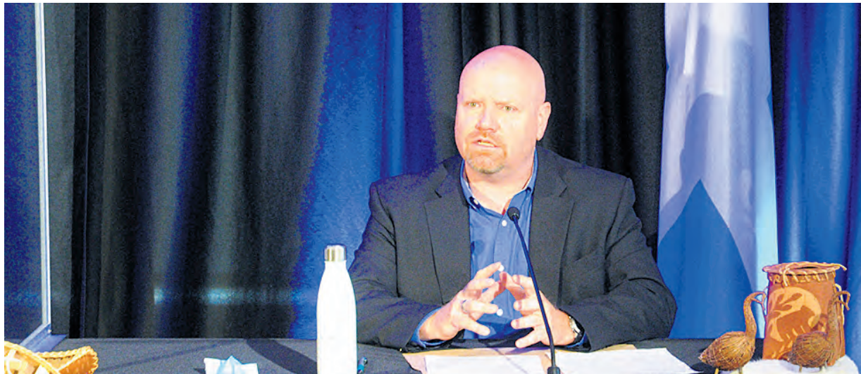
Le ministre Ian Lafrenière était fier et ému d'avoir pu aider des familles autochtones à retrouver des proches disparus.