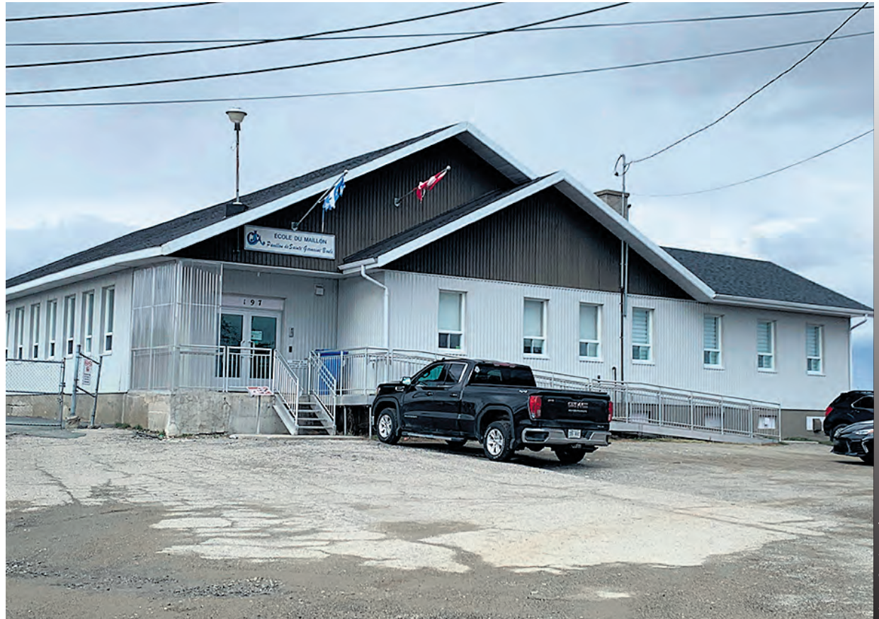
Le pavillon Boulé de l'école le Maillon, situé à Sainte-Germaine-Boulé, en Abitibi-Ouest