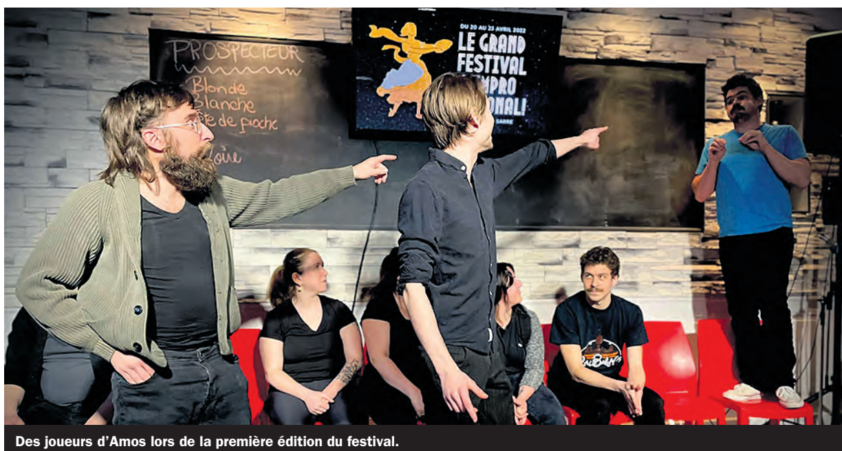
Des joueurs d'Amos lors de la première édition du festival.

Le vendredi 19 mai, c'est la Soirée d'Improvisation de Rouyn-Noranda (SIR-N) et l'Improvatorium du Professeur Lebel qui vous attendent pour une soirée sous la théma-