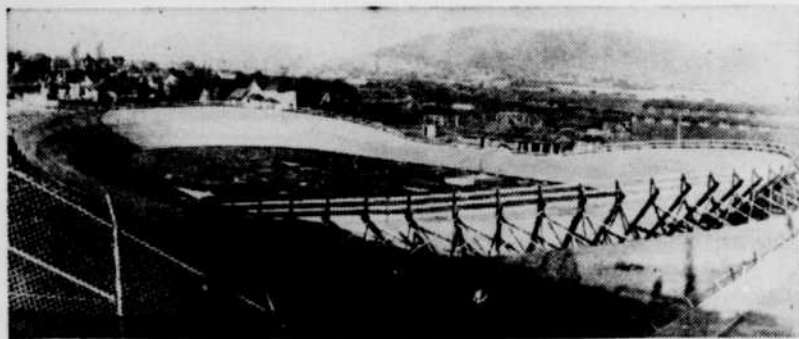
Le stade Empire Oval de Vancouver a été construit spécialement pour les Jeux de l'Empire. C'est là que se dérouleront les épreuves de cyclisme. Ce stade a une capacité de 4,500 spectateurs assis.

Les épreuves mettront en cause 59 championnats, et probablement nombre de records mondiaux. Les sports représentés seront la course, le saut, la natation, le cyclisme, la rame, les poids et haltères, l'escrime, le bowling extérieur, la boxe et la lutte.