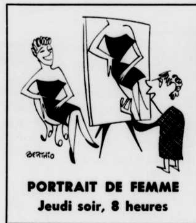
PORTRAIT DE FEMME Jeudi soir, 8 heures

FAFOUIN revient tous les mercredis après-midis à CBFT et CBOT, de 5 h. 30 à 6 heures. Cette émission que réalise Fernand Doré met en vedette la troupe du GRENIER , dirigée par Guy Messier. Dans la photo ci-haut, on reconnaît, de gauche à droite : Maboul, le pirate; Fafouin, le clown; Gudule, l'horloge; et Fanfreluche, la poupée. Chaque émission de FAFOUIN nous réserve de nouvelles aventures ou de nouveaux personnages. Cette semaine, le 28 juillet, on fera connaissance avec Hans von Guttenacht, l'antiquaire, et madame My-Eye, une vieille snob. Cette série se prolongera jusqu'au début de septembre.