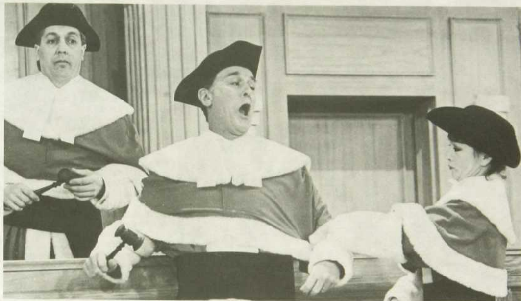
Normand Chouinard, Gérard Poirier et Véronique Le Flaguais