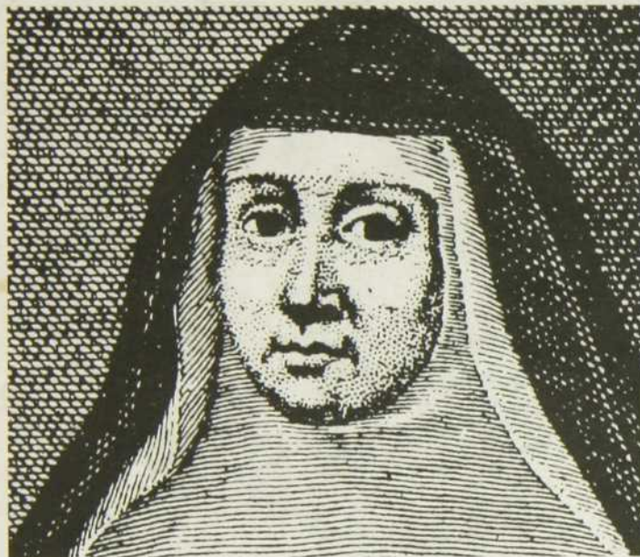
Mère Marie de l'Incarnation