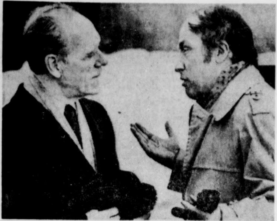
Le premier ministre du Canada s'est entretenu quelques instants avec M. Mitchell Sharp, ministre des Affaires extérieures, quelques instants avant son départ pour l'Asie, à l'aéroport Uplands, hier, à Ottawa. M. Sharp agira comme premier ministre suppléant en l'absence de M. Trudeau.