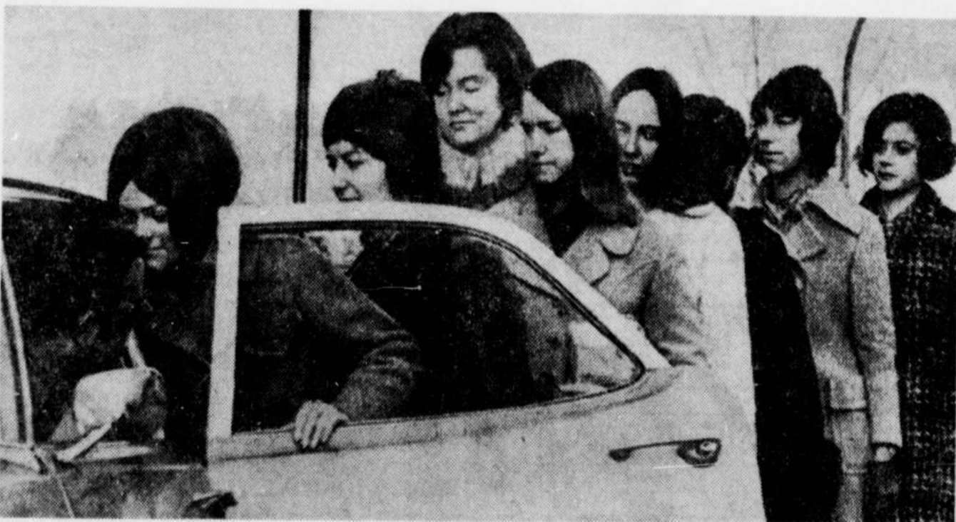
Les jolies secrétaires comme les hommes d'affaires n'avaient pas d'autre choix, hier à Vancouver, que de faire de l'auto-stop ou de s'empresser dans toutes les autos disponibles, alors que la deuxième journée de grève des employés de transport en commun battait son plein. C'est étonnant dans une telle occasion, comme on peut arriver à mettre de gens dans la moindre petite auto.