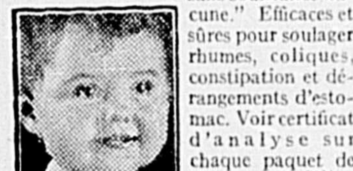
TABLETTES BABY'S OWN du Dr. Williams