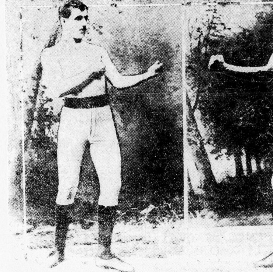
A gauche, JAMES J. CORBETT; à droite, BOB FITZSIMMONS, tels qu'ils apparaissent dans leur joute mémorable quand Corbett perdit son titre. Les connaisseurs disent que personne de la génération actuelle ne peut égaler la science et la valeur de ces deux étoiles.