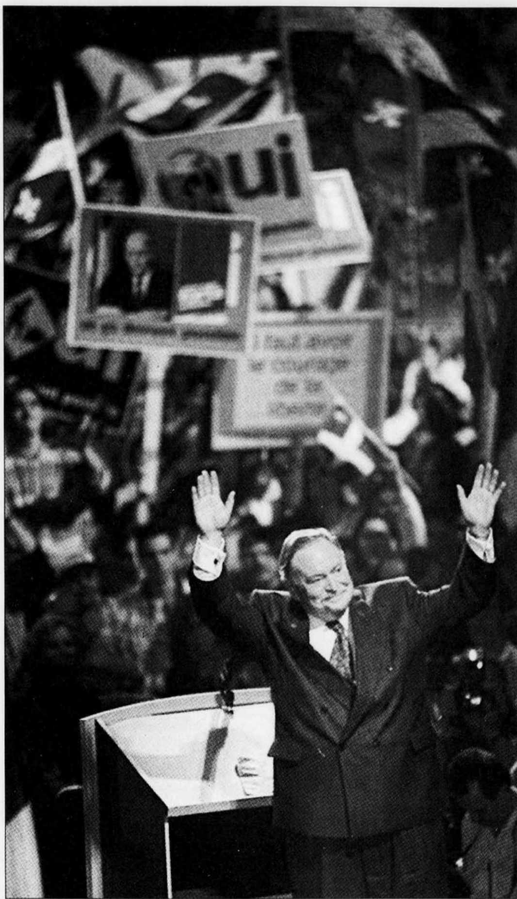
25 octobre 1995. Jacques Parizeau reçoit un accueil chaleureux des partisans du Oui lors d'une assemblée partisane à Montréal. Quelques jours plus tard, le chef péquiste encaissera difficilement la défaite. Les propos qu'il tiendra alors amèneront les politiciens et les intellectuels à redéfinir la nation québécoise pour l'expurger de toute référence ethnique.

Il faudrait peut-être reconnaître que la connaissance de l'histoire du Québec et de sa culture demeure essentielle à une meilleure intégration de ceux et