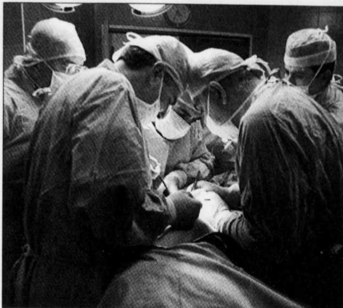
Au moins quatre immigrants qui ont eu affaire avec le système de santé sont morts alors qu'ils auraient dû vivre, soutient le coroner Jacques Ramsay.

Pour le coroner, il y a là une faille à combler. À cet égard, l'exemple des cliniques ontariennes destinées aux sans-papiers est une voie intéressante à explorer. Le Dr Ramsay a toutefois refusé de se prononcer sur l'universalisation des soins de santé pour tous, un domaine qui revient d'office au ministère de la Santé, a-t-il