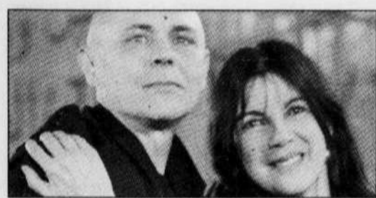
Carole Laure et Lewis Furey, hier, à Marrakech.