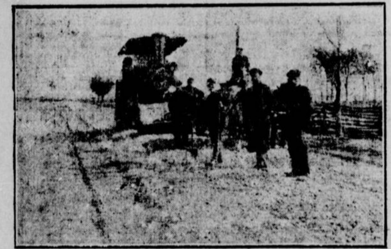
COMMENT ON CONSTRUIT UNE BONNE ROUTE