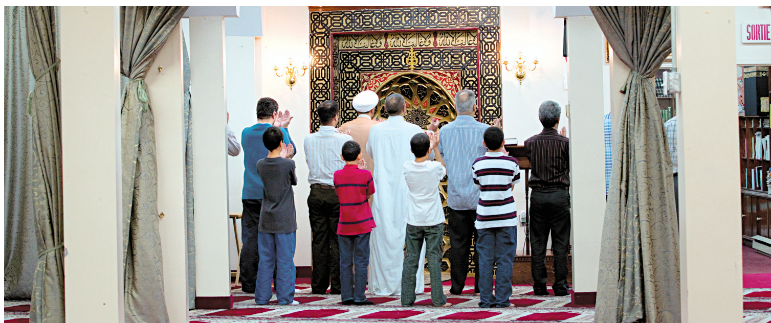
ANNIK MH DE CARUFEL LE DEVOIR

Le mot «ramdam», transformé par altération au XIX e siècle, vient de l'arabe magrèbin «ramadan», en raison des bruyantes et festives célébrations nocturnes de la rupture du jeûne.