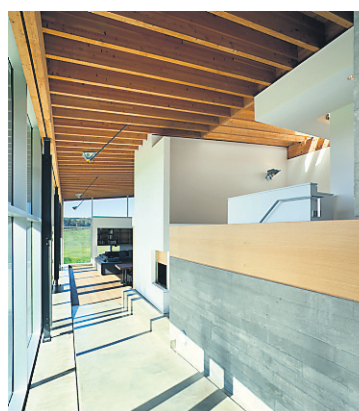
Une longue rampe permet d'accéder facilement aux pièces de vie. À droite, un mur de béton sert de masse thermique afin d'accumuler la chaleur le jour, en hiver. Le soir, elle est redistribuée.