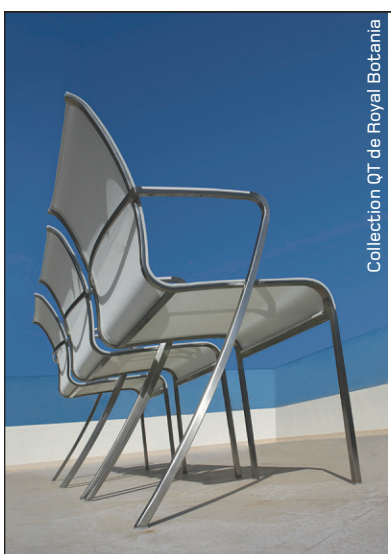
Collection QT de Royal Botania