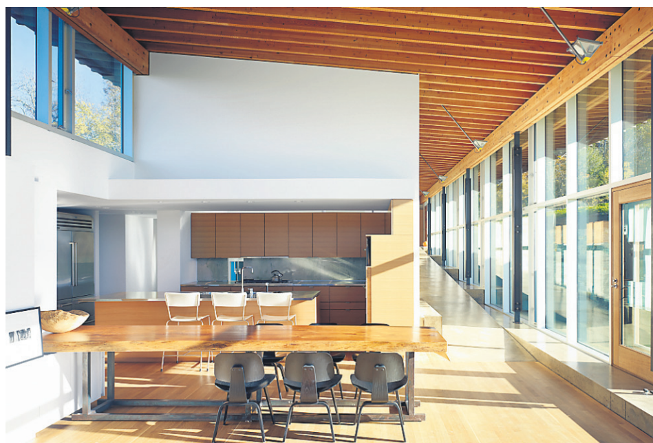
À la place d'un escalier, une rampe en béton poli a été privilégiée. Elle permet d'admirer le cours d'eau le long de la façade vitrée sans craindre de tomber. Même si le plafond ne fait que 2,2 mètres de hauteur, on s'y sent à l'aise, car elle donne sur la façade vitrée, offrant une vue spectaculaire sur le paysage. Une pompe géothermique sert à chauffer et climatiser les lieux. Le sol couvert de chêne blanc est radiant. La structure en sapin lamellé-collé du plafond est visible partout dans la maison.