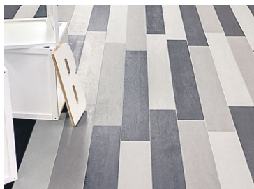
Un mélange de différentes teintes de céramique Flow pour jouer sur la géométrie.

On recommande d'utiliser la Flow sur les planchers, mais