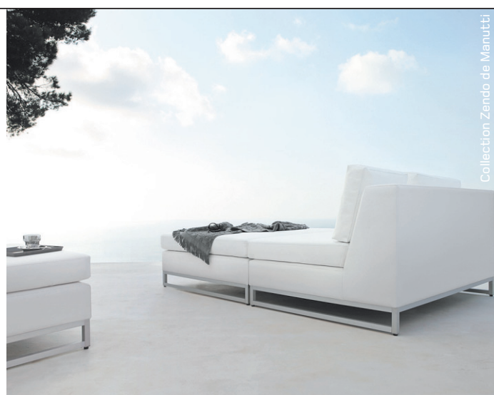
Collection Zendo de Manutti