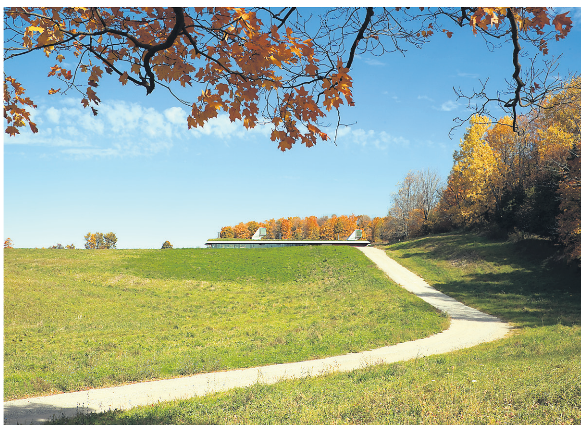
De la route, on ne distingue que les deux « périscopes » de la Maison à Caledon.

Un cours d'eau coule entre le mur de granit et la façade vitrée d'une longueur d'environ 100 pieds (30 mètres). Surmontant la façade, un large débord de toit évite la surchauffe, l'été. Sa sous-face est composée de bois lamellé-collé brut et est dotée de luminaires. Le plafond de l'autre côté des fenêtres, à l'intérieur, est identique. Une illusion de continuité est ainsi créée. Devant la porte en teck, un caillebotis encastré dans le béton sert de « paillason ».