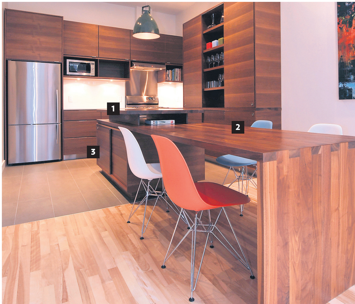
Conçu par l'architecte Natalie Dionne, cet îlot 1 en noyer (et sans évier) se prolonge en une longue table 2 qui peut accueillir jusqu'à six convives. Bonne idée: les espaces de rangement de l'îlot sont fermés par des portes coulissantes 3 , ce qui est moins encombrant que des tiroirs.