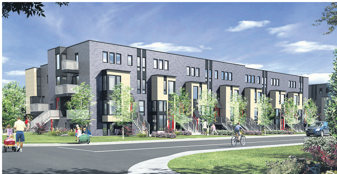
ILLUSTRATION FOURNIE PAR LA SHDM

Deux ans après le lancement de Faubourg Contrecoeur, environ 500 des 1850 unités d'habitation prévues sont déjà habitées ou sur le point de l'être. De ce