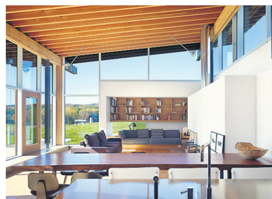
Un coin douillet a été créé dans le vaste espace de vie. Ce « refuge » comporte un canapé surmonté d'une ouverture horizontale à la hauteur des yeux. Une bibliothèque et une cheminée font également partie des lieux. L'aménagement d'une grande fenêtre située dans l'axe de circulation cadre magnifiquement le paysage.