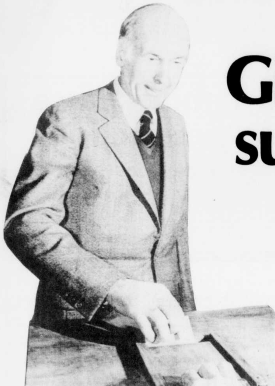
Le président Valéry Giscard d'Estaing a voté, à Chanonat, petite ville du centre de la France, lors du premier tour des élections françaises qui s'est déroulé hier.

ISOLATION LE NO 1 DANS L'ESTRIE Résidentiel Commercial Industriel 562-4682