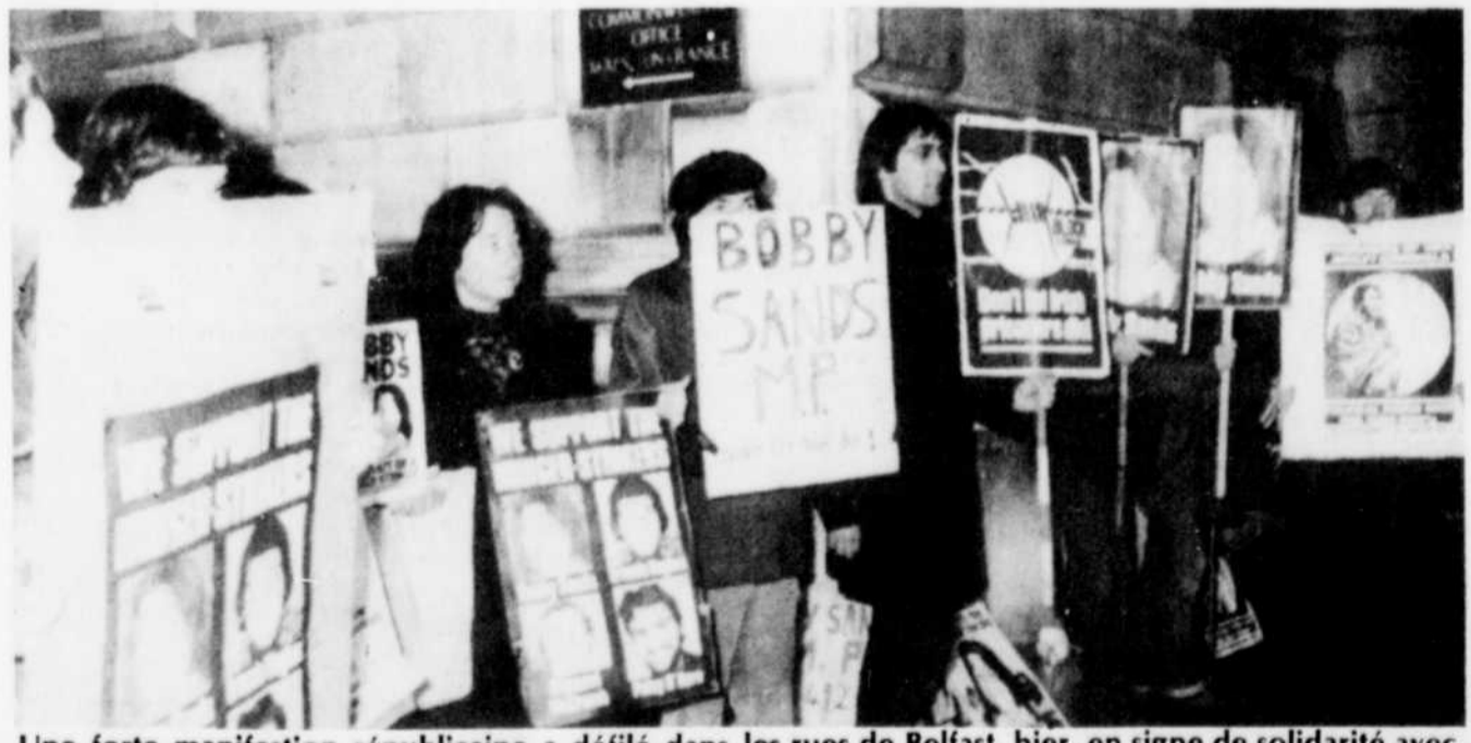
Une forte manifestation républicaine a défilé dans les rues de Belfast, hier, en signe de solidarité avec le gréviste Bobby Sands.

des droits de l'homme, parce que les autorités ont refusé à trois sympathisants de l'IRA emprisonnés d'assister à l'entretien.