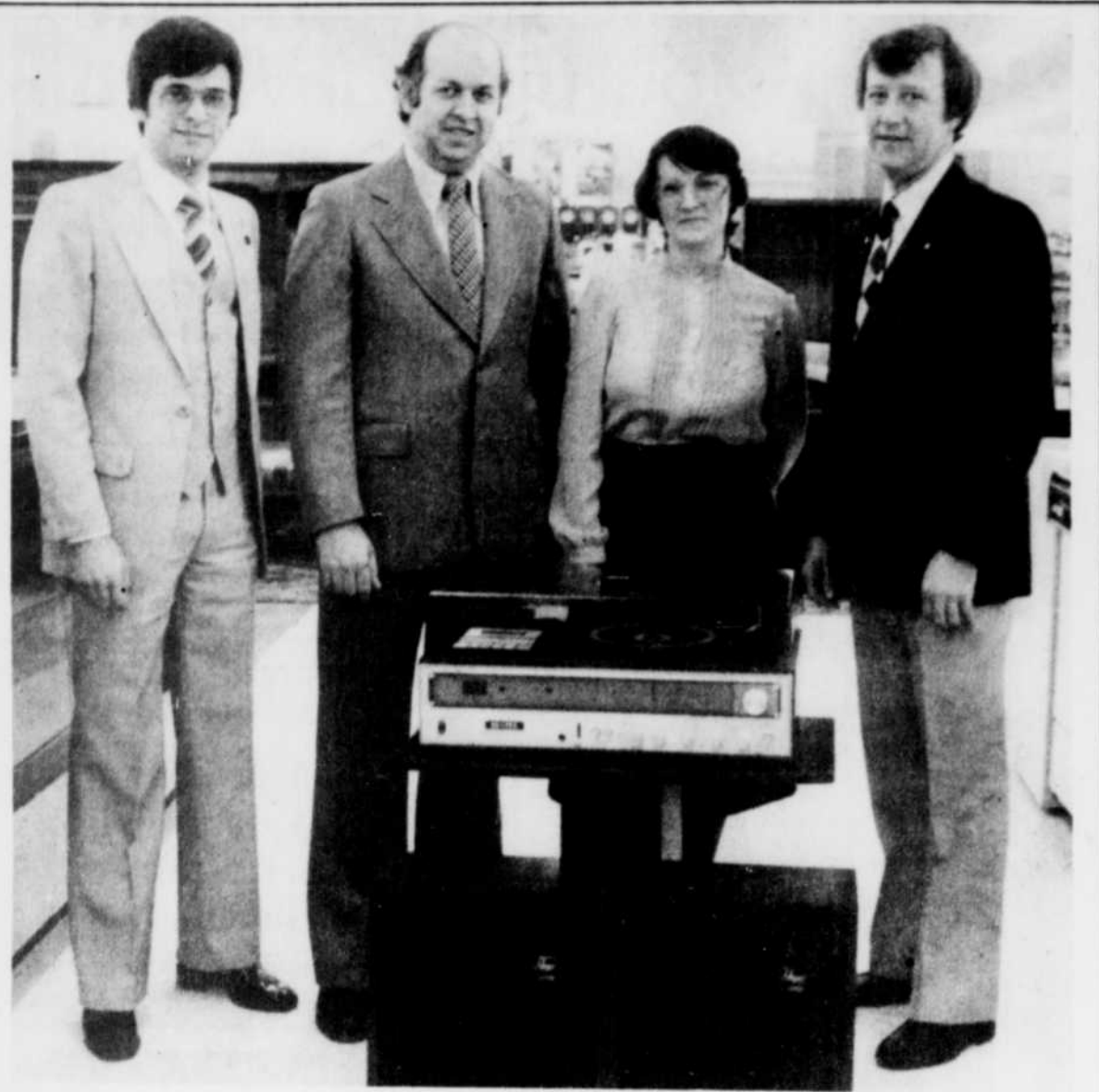
Programme de musicothérapie

Le club kinsmen de Sherbrooke a fait don d'un appareil stéréo à l'Unité 61 de soins prolongés à l'hôpital d'Youville, dans le cadre d'un programme de musicothérapie; 28 personnes bénéficieront de ce programme. Sur la photo, de gau-