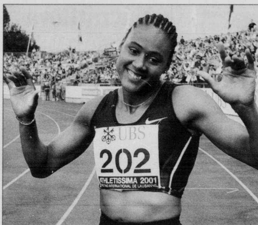
Marion Jones a eu chaud, mais elle a conservé son invincibilité sur 100 m.