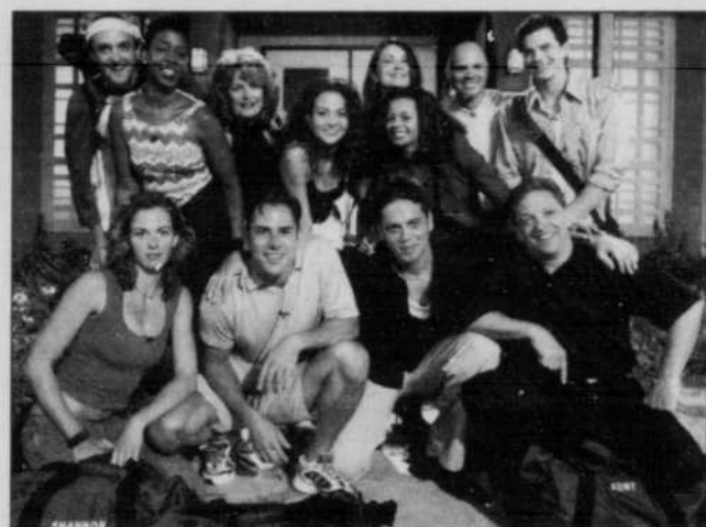
Aux États-Unis, les participants à l'émission « Big Brother 2 » sont entrés en réclusion cette semaine.

Même logique pour les SMS, ces messages courts permet-