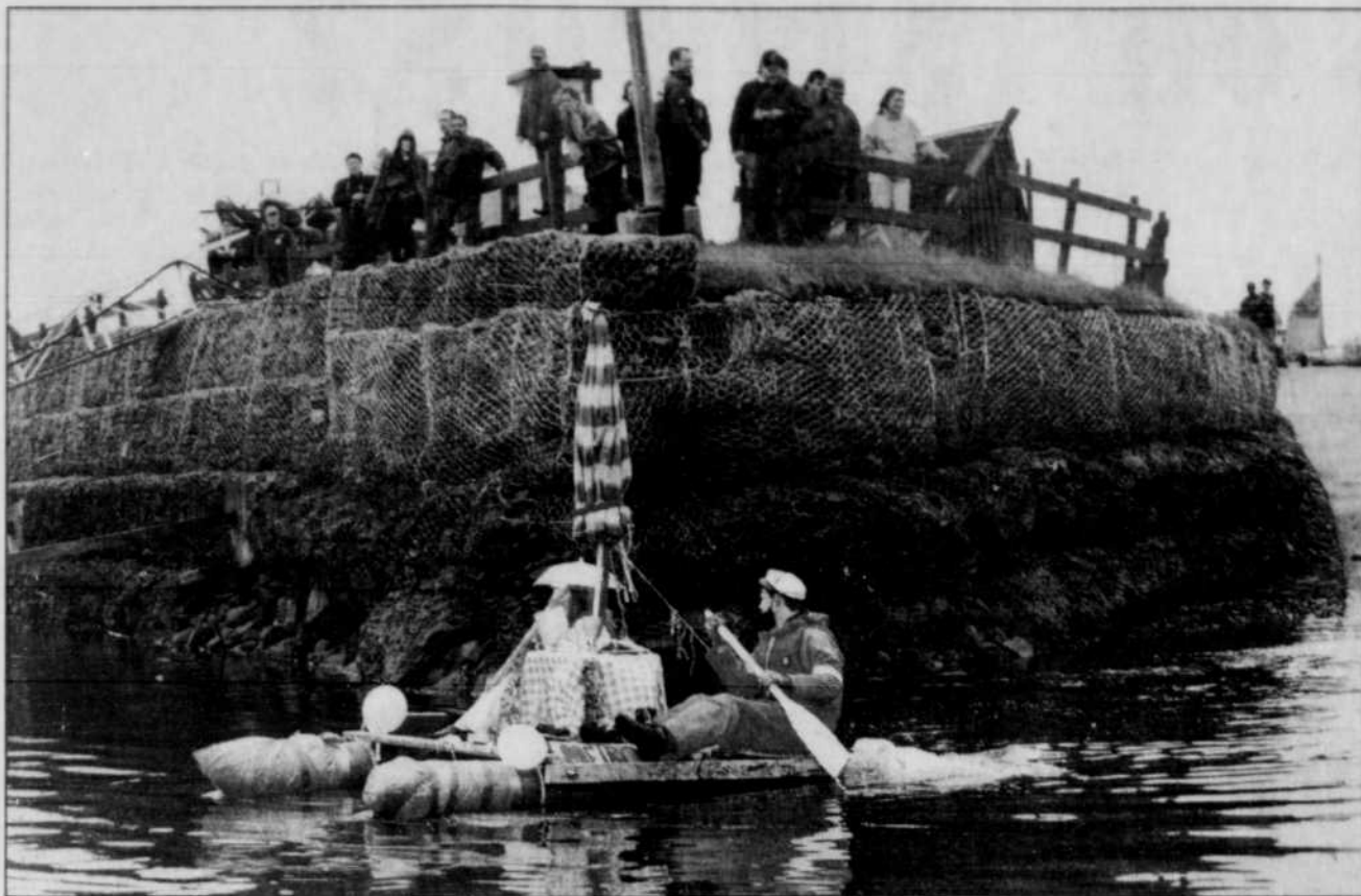
COLLABORATION SPÉCIALE, ROMAIN PELLETIER

La fête nautique Cap sur Matane hissera les voiles du 19 au 22 juillet. Encore cette année, compétitions de voile, concours de châteaux de roches et spectacles (Fox River Band, Chut! et Les Amants de Rita) sont au programme. Cette cinquième édition débutera notamment par une journée spéciale consacrée aux ados. Le souper des capitaines du samedi mariera pour sa part le baladl aux plats d'Hawaï... Exotique! R.P.