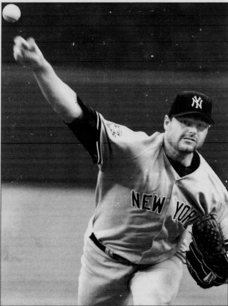
Roger Clemens sera l'un des nombreux Yankees au match des étoiles.

Les réservistes au champ intérieur sont Sean Casey, des Reds de Cincinnati, Ryan Klesko et Phil Nevin, des Padres de San Diego, Jimmy Rollins, des Phillies de Philadelphie, et Albert Pujols, des Cards de St. Louis. La liste des voltigeurs comprend Moises Alou et Lance Berkman, des Astros de Houston, et Brian Giles, des Pirates de Pittsburgh.