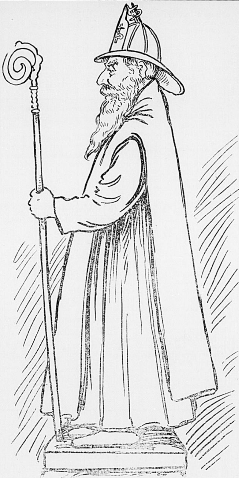
Nouvelle statue de St-Eloi qui sera prochainement offerte à un sous-chef des pompiers de Montréal.

petit St-Jean-Baptiste du quartier Hochelaga, était le plus beau, et reposait sur le plus beau char allégorique qu'on ait pu voir depuis quelques années dans nos processions. Or, fidèles à leur coutume, les juges du concours n'ont pas manqué de décerner le premier prix à un autre.