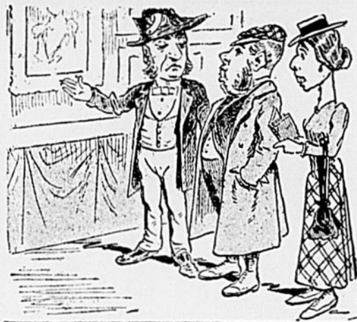
— Ça, c'est la photographie, par le peintre de la Cour, de la Pompadour, la connaissance de Louis XV.

Ce plan, expliqué avec indifférence, par deux criminels endurcis, éveilla l'indignation du sergot ; les deux voltigeurs parlent plus bas, et expliquent leur plan machiavélique avec tant de prudence qu'a peine devine-t-il la moitié des moyens d'exécution du complot. On parle de dépouiller la victime, de cacher son cadavre, avec autant de désinvolture que s'il s'agissait de couper à une revue. Tant l'habitude du