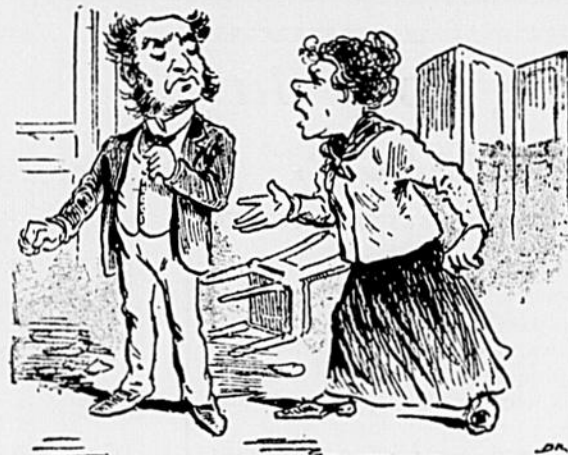
— Je ne suis pas, moi, de ces hommes à deux visages... — Et c'est heureux... quand on a une sale tête comme la tienne, c'est assez d'une.

crime étouffe les remords et la voix de la conscience ! ! ! Puis, un soubresaut du sergent met les criminels sur leurs gardes, et leurs ronflements sonores se joignent bientôt au concert nocturne des gorges et des nez des autres hommes de garde.