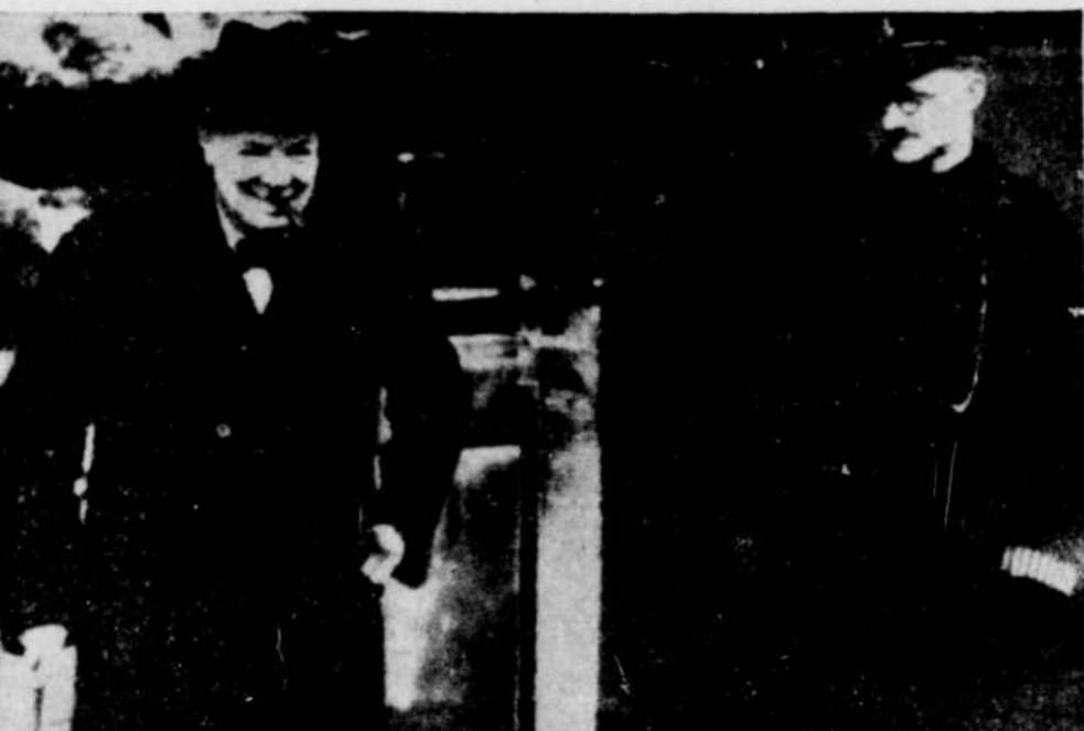
Le premier ministre Winston Churchill est après la conférence de Téhéran. Le premier ministre semble gai et en bonne santé. Il a été longuement ovationné par les membres de la Chambre des Communes pour la première fois depuis son attaque de pneumonie au Moyen-Orient.