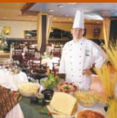
Service à la clientèle hors pair, raffinement de la table : le Château Bromont est un hôtel quatre étoiles reconnu.

Lauréat argent Holiday Inn Saguenay - Centre des congrès (Jonquière)