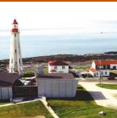
Vue aérienne partielle du Musée de la mer de Pointe-au-Père. En avant-plan, le nouveau pavillon Empress of Ireland .

Lauréat Musée maritime du Québec (L'Islet-sur-Mer, Chaudière-Appalaches)