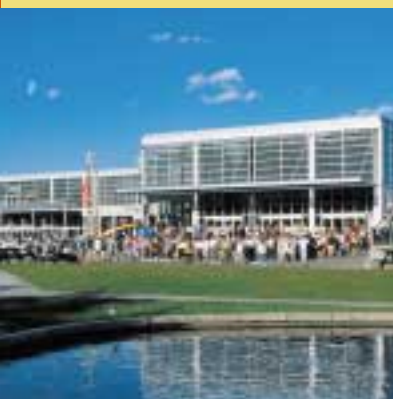
Le Centre des sciences de Montréal

Lauréat argent Parc du Bic, SEPAQ (Le Bic, Bas-Saint-Laurent)