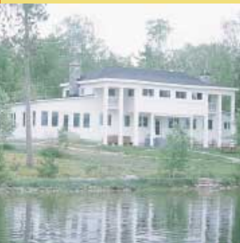
La «White House», pavillon d'accueil de la Réserve, juste en face du magnifique lac Beauchêne.

Lauréat La Pourvoirie du Lac-Holt (Région de Duplessis)