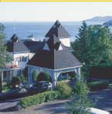
Un « grand hôtel miniature » où l'on sert une cuisine de tradition, gourmande et généreuse, aux saveurs renouvelées.

Lauréat bronze La Marée haute (Havre-Aubert, Îles-de-la-Madeleine)