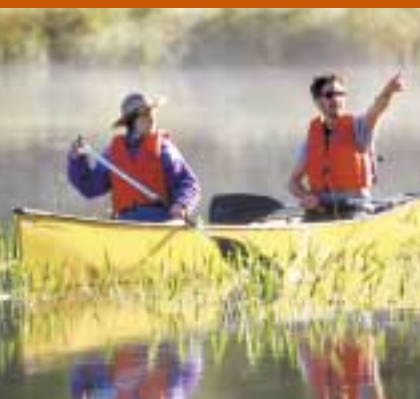
Le Centre des visiteurs, entièrement rénové, et des canoteurs sur la rivière Rideau.