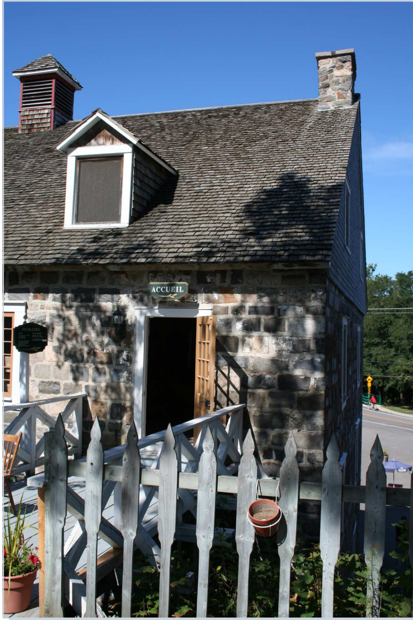
Avec ce livre, s'ouvre désormais une porte sur la connaissance des faits et gestes des premières générations de Kervoach en Amérique du Nord.