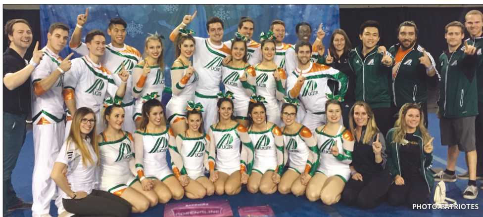
L'équipe de cheerleading des Patriotes lors du championnat Adrenaline du 3 décembre 2016 à Montréal.

Bien que l'équipe d'entraîneurs soit très heureuse des résultats de la compétition de samedi, elle ne vise pas la victoire à tout prix. «Les