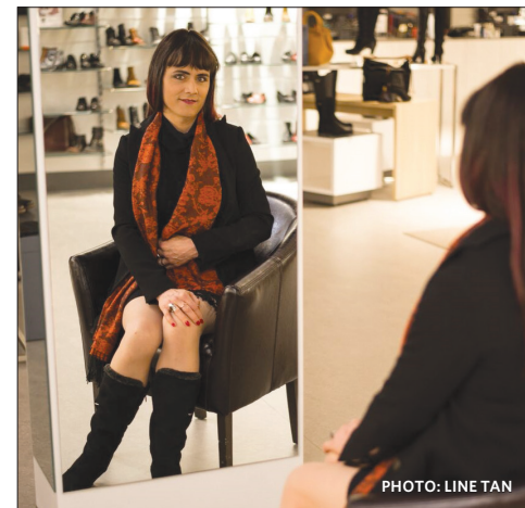
Ses proches ont constaté qu'elle semblait beaucoup plus heureuse depuis qu'elle pouvait enfin assumer sa vraie nature.

L'AES produira bientôt un calendrier et la conférencière se prêtera également au jeu de modèle d'un jour, en plus de continuer à donner des conférences et de travailler comme forgeronne à son compte. Cette rencontre a été fort inspirante et touchante pour tous les gens présents dans la salle mercredi dernier. (C.F.)