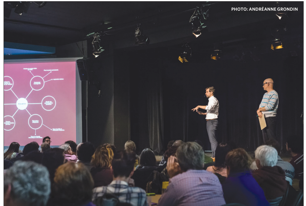
Gabriel Nadeau-Dubois devant les gens attentifs de Trois-Rivières.

La soirée était divisée en trois parties. Elle a commencé par une table ronde d'environ 40 minutes, qui a tourné autour de trois thèmes récurrents au Québec: la démocratie, l'éducation