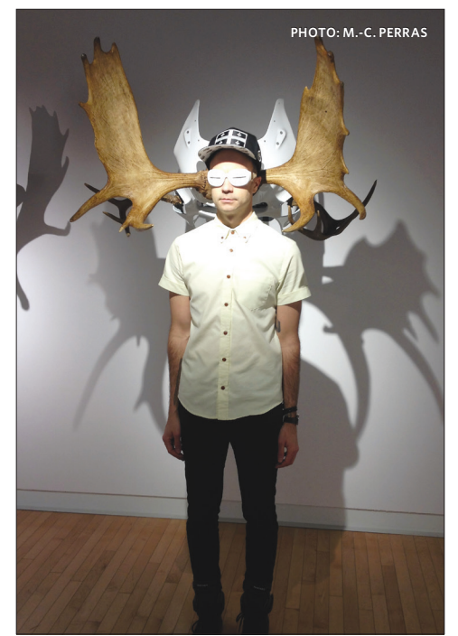
Les bêtes lumineuses à la charge epormyable sont les véhicules politiques non chevauchés par le peuple québécois.

Véhicule et Scap de Simon Beaudry et Méandres de François-Matthieu Bouchard sont présentées jusqu'au 8 janvier 2017. (M.-C.P.)