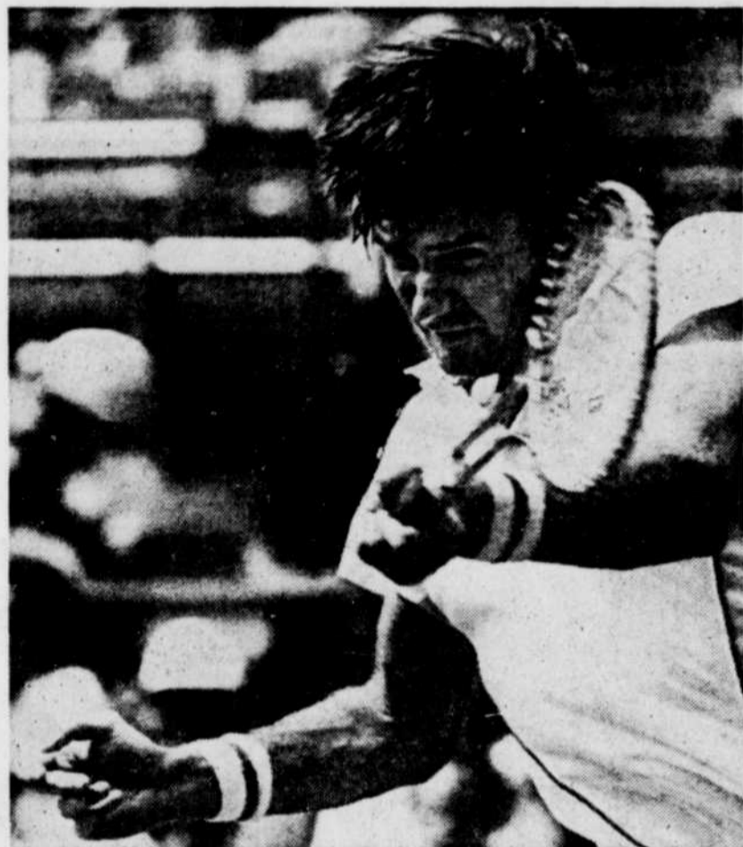
Jimmy Connors a atteint la ronde demi-finale des Internationaux de New York pour la 10e année consécutive.

NEW YORK (AFP) — Chris Evert-Lloyd (E.-U. n. 2, victorieuse de la Tchèque Hana Mandlikova): "Je crois que nous avons joué un bon match. En dépit du fait que je compte un palmarès de 15 victoires contre 2 défaites face à Mandlikova, la Tchèque est une des joueuses les plus talentueuses du circuit féminin. Que ce soit en coups droits ou en revers, elle est toujours dangereuse. Je pense que j'ai joué aujourd'hui mon meilleur match depuis le début de la compétition. Tout m'a réussi, j'ai bien servi et mes retours étaient également bien ajustés. Devant Jo Durie, en demi-finale, ce sera peut-être plus difficile, car la Britannique est en grande forme actuellement. Je suis néanmoins confiante pour atteindre la finale.