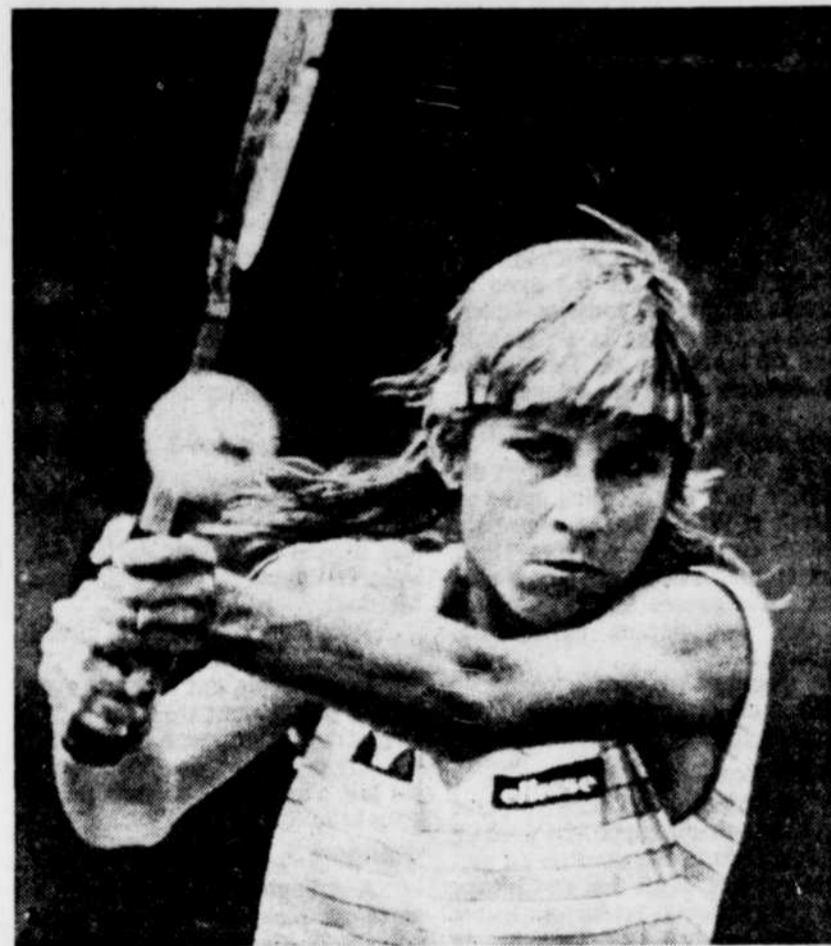
Chris Evert sera de la demi-finale pour une 13e année consécutive.