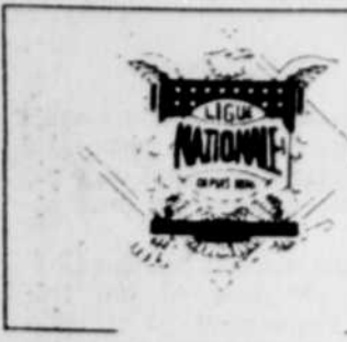
Tableau des résultats