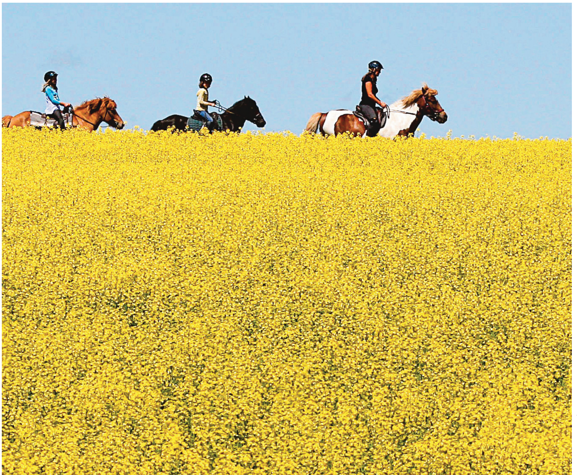
Les champs de canola (notre photo) et ceux de maïs-grain destiné au bétail sont régulièrement contaminés par les OGM, au grand dam des producteurs biologiques.