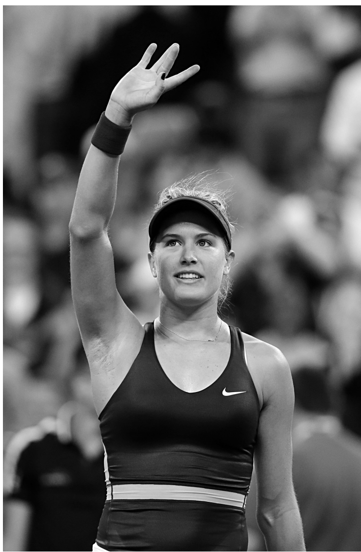
Eugenie Bouchard salue la foule du stade Arthur-Ashe après sa victoire jeudi en fin de soirée.

« J'ai vaguement entendu des cris », a-t-elle dit du premier match qu'elle a disputé au stade Arthur-Ashe dans les rangs professionnels. « J'essaie vraiment de bloquer ça et de me concentrer sur le travail à