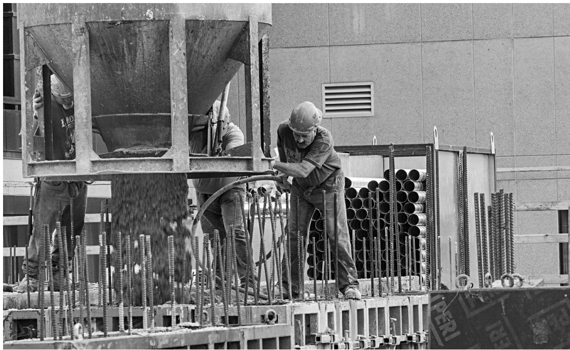
MICHAEL MONNIER LE DEVOIR

Les nouvelles conventions collectives entreront donc en vigueur le 31 août et elles s'appliqueront tout de même à la FTQ-Construction. La nouvelle loi stipule en effet que pour être adoptée, une convention collective doit être entérinée non seulement par une majorité des membres, mais qu'elle doit également l'être par au moins trois des cinq organisations syndi-