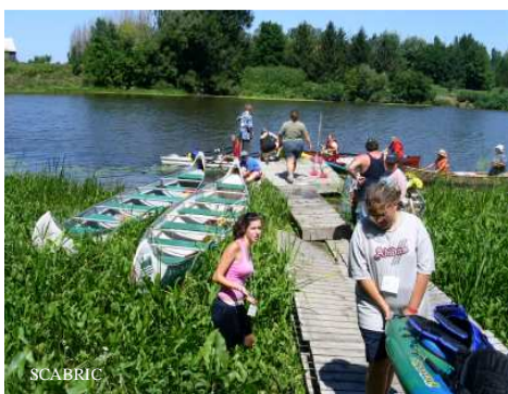
Le Canot d'Août en 2005

La composition du conseil d'administration est représentative des intervenants du milieu