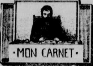
MON CARNET - BILLET