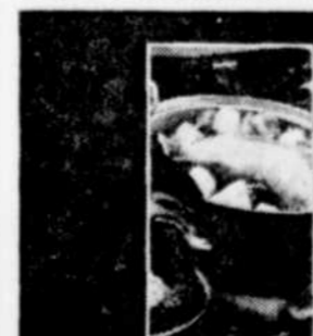
CUISINE DU QUÉBEC