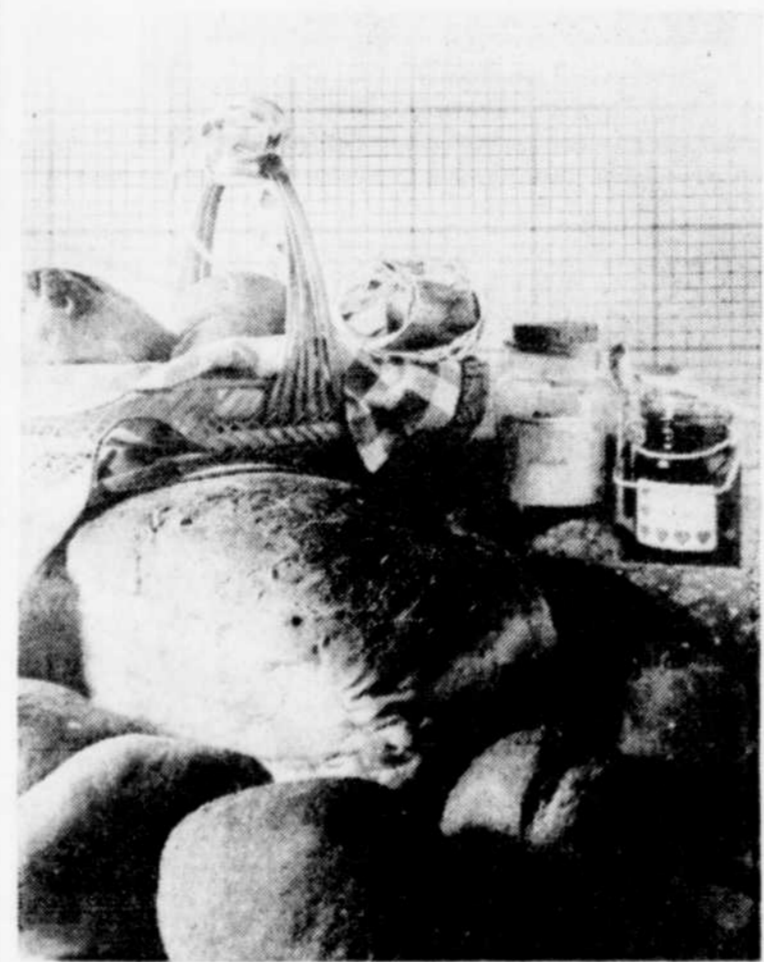
Pain au fromage.