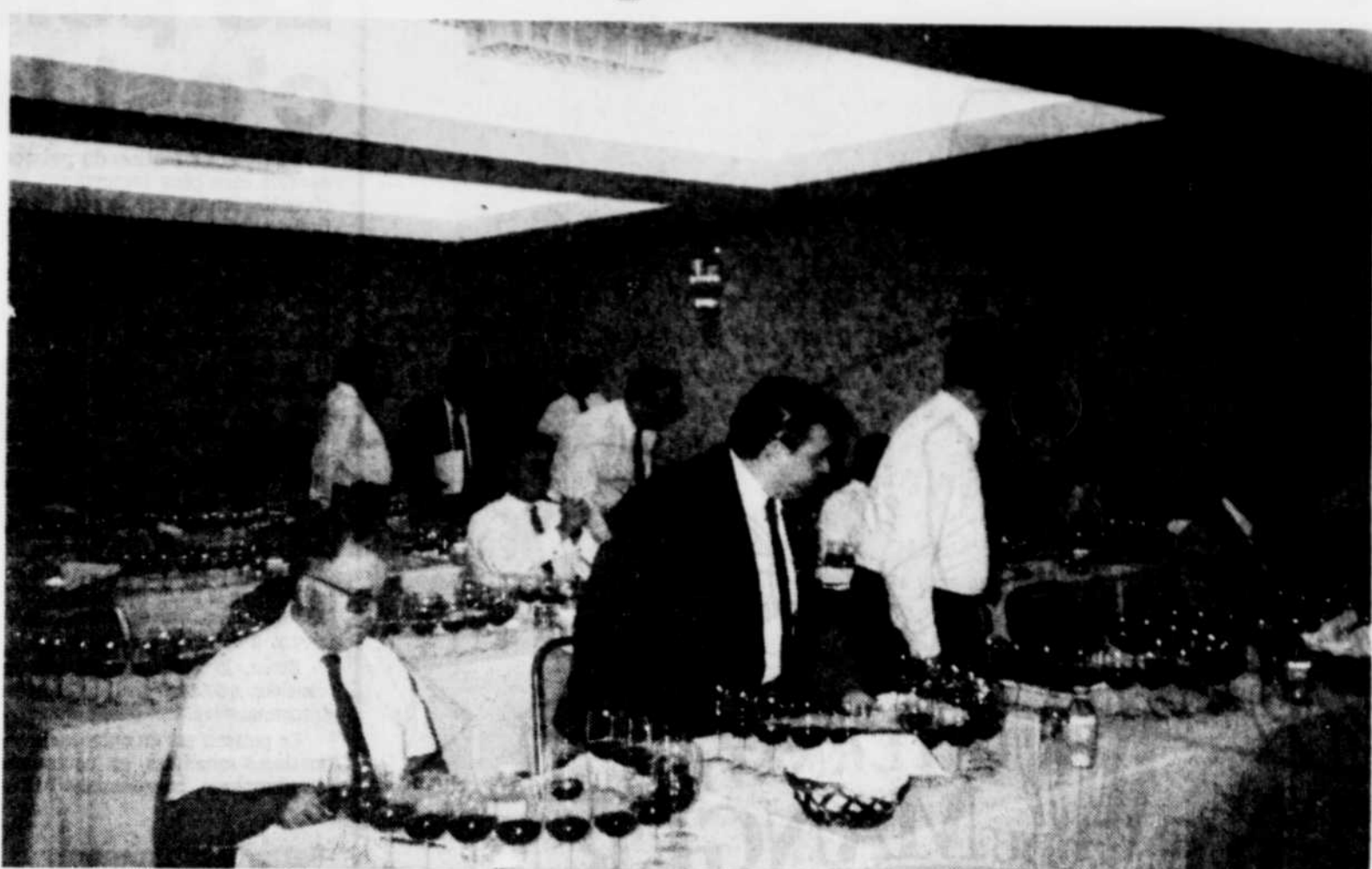
Des dégustateurs chevronnés se préparent à passer de longs moments à mirer, humer et goûter, presque religieusement, le produit de la vigne.

vin, qu'il soit rouge ou blanc ou encore rosé, indique déjà la concentration des saveurs et des parfums. Vous aurez toujours, quel que soit le vin, encore une fois, certains arômes ou certaines saveurs. Mais un vin de qualité dont la couleur est franche et relativement intense, laissera présager un bouquet et des aspects gustatifs plus prononcés que le vin à la couleur faiblarde.