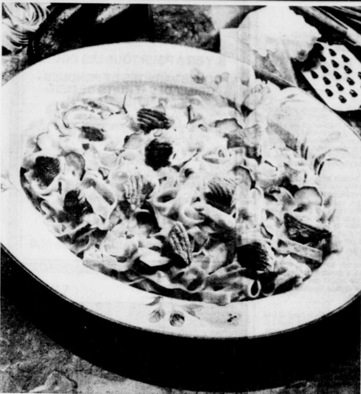
Le fettuccine au saumon, un plat délicieux qui plaira autant aux amateurs de pâtes qu'aux gourmets qui font leurs délices du poisson.