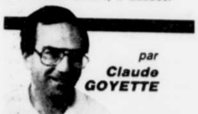
par Claude GOYETTE

Le monde de la restauration est très peu représenté au Festival international du Boire et du Manger. Seulement huit restaurateurs sur une possibilité d'environ 400, c'est un reflet très pâle d'une industrie fort active, à Québec.