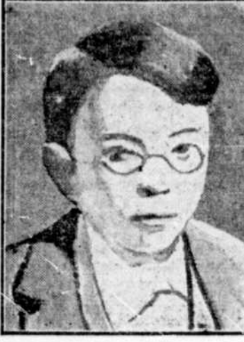
THEODORE ROOSEVELT, JR.

ACCIDENT (Du correspondant régulier de LA PRESSE) Québec, 14 — Le SS. "Britannic", un navire, qui transporte du charbon de Sydney à Québec, et Montréal, a été coupé en deux la goélette "Stella Maris", cet avant-midi, en sortant du bassin Lachine.