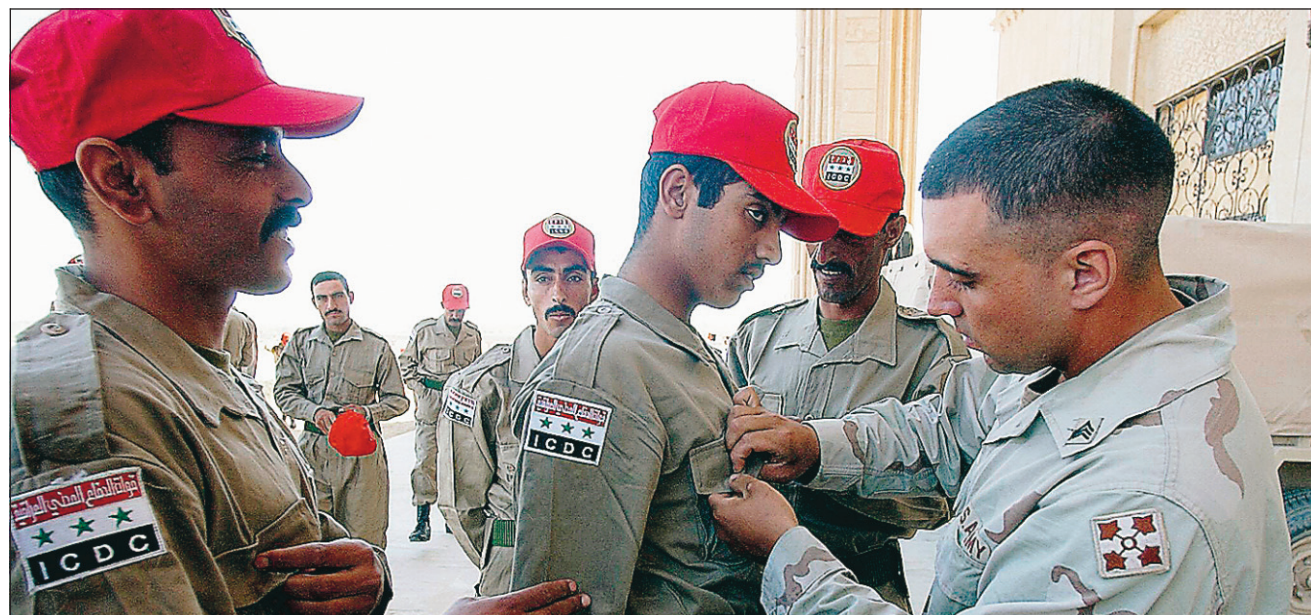
Un soldat américain boutonne la chemise d'un cadet irakien avant le début des séances de formation du Corps de défense civile irakien dans un ancien palais de Saddam Hussein, à Tikrit, en Irak. Une soixantaine de ces cadets patrouilleront la région avec les troupes américaines.