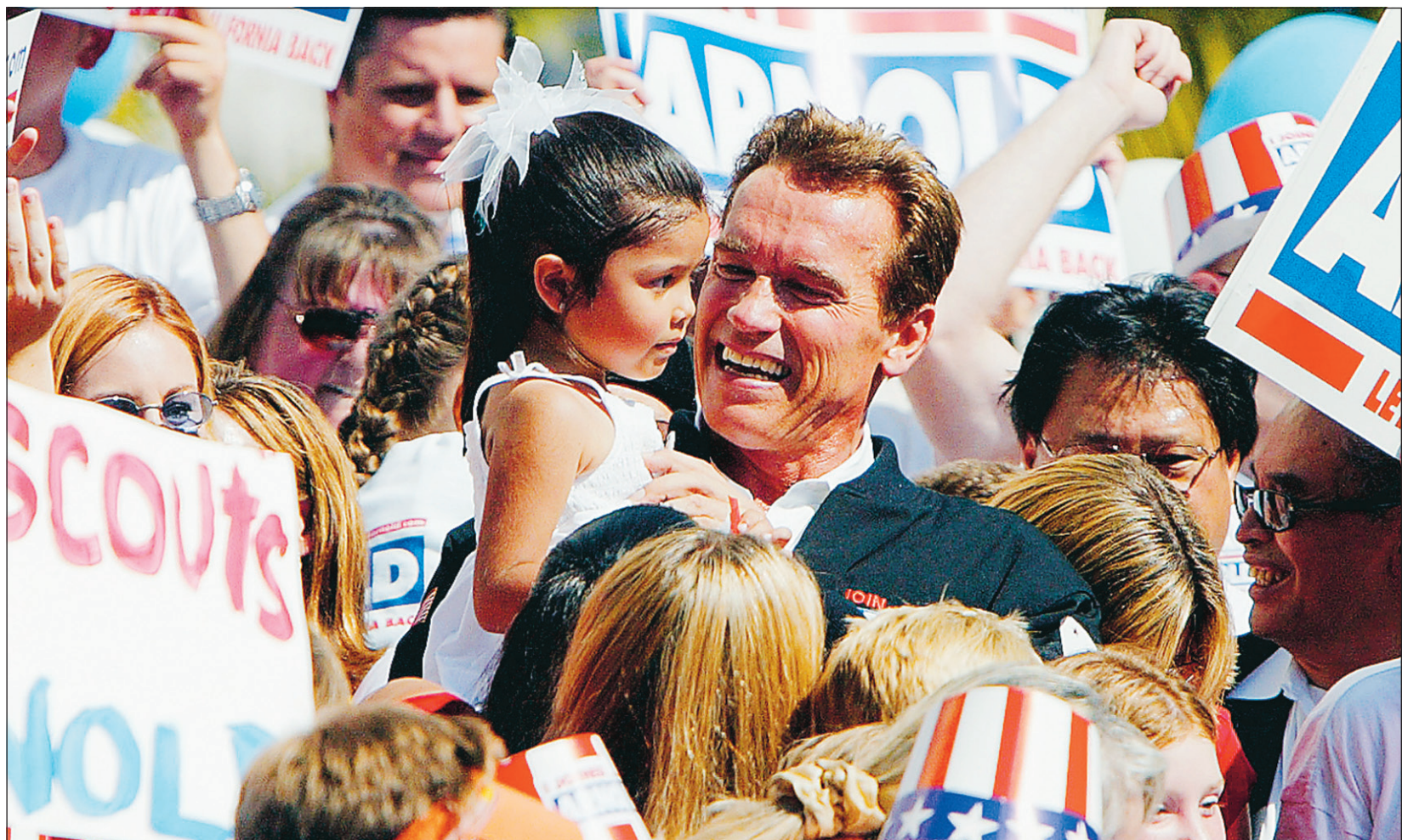
Le candidat républicain Arnold Schwarzenegger prend une fillette dans ses bras lors d'un rassemblement à Sacramento en Californie.