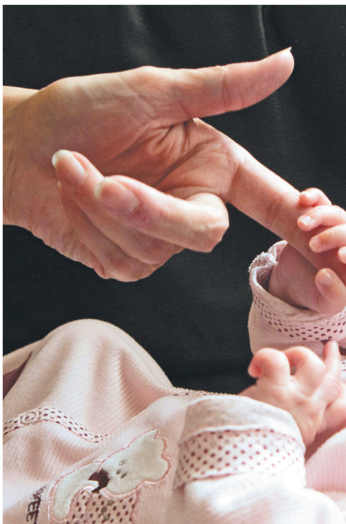
Le débat fait rage et pas seulement au Québec et au Canada sur la maternité pour autrui.

«Cette pratique a explosé dans les années 2000 dans des pays comme l'Inde et la Thaïlande. Depuis, ces deux pays ont interdit l'accès des ressortissants étrangers aux cliniques de mères por-