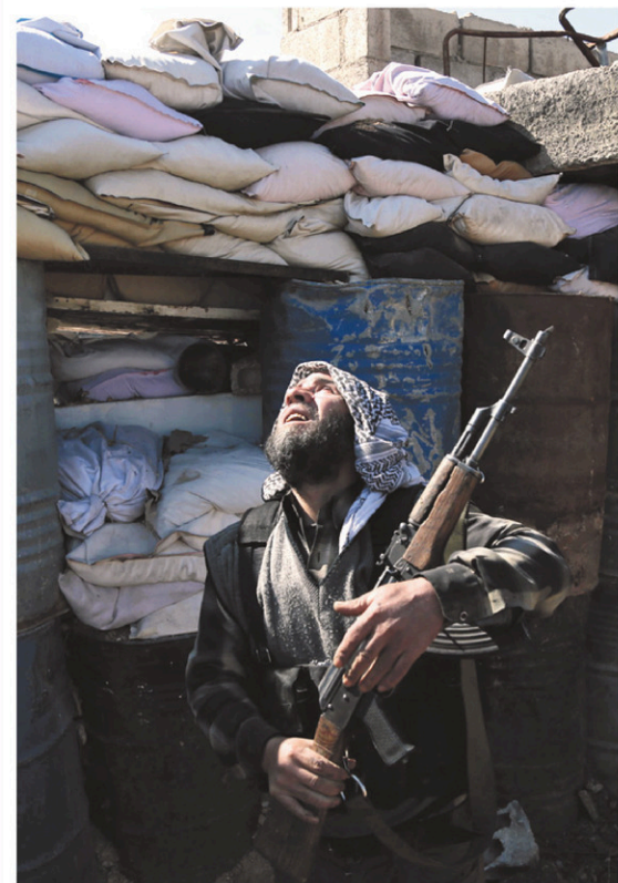
Un rebelle syrien sur la ligne de front surveillant vendredi les positions des soldats du régime à Ghouta.