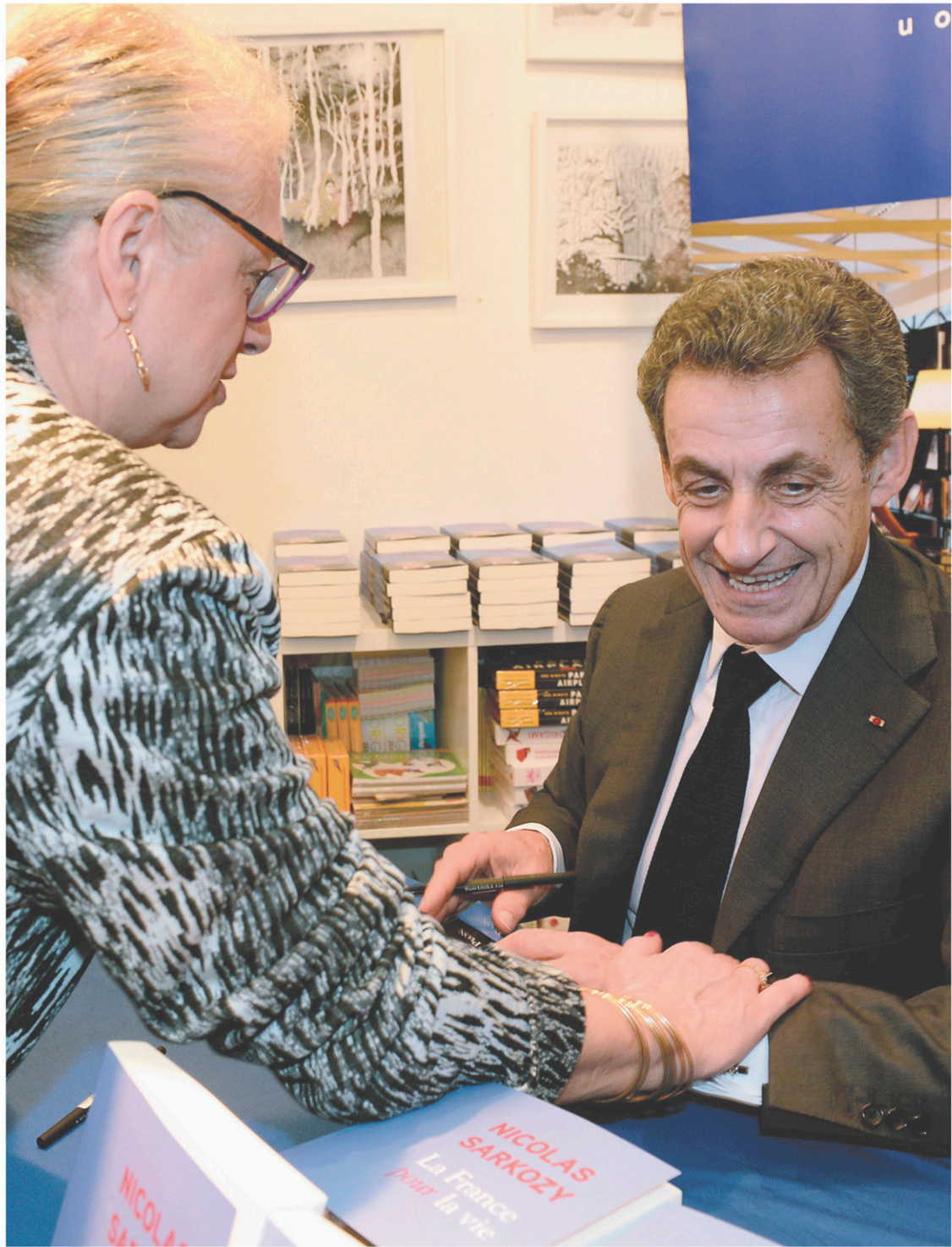
Nicolas Sarkozy n'est qu'un des hommes politiques français qui ont récemment lancé un livre.

La formule est à peine exagérée puisqu'on attend encore les livres d'Hervé Mariton et Na-