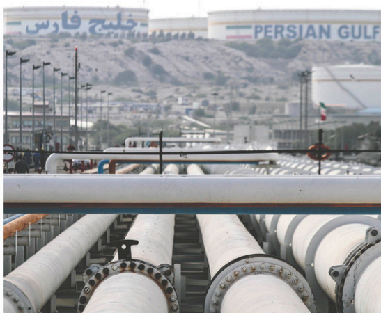
Les installations pétrolières de l'Iran sur l'île Khark