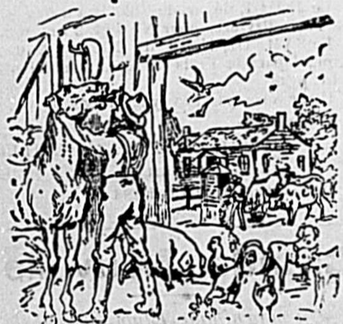
L'AMI DES PAUVRES.

LE SIROP DE CODERRE est parfaitement sûr et peut être administré sans aucun danger contre les maladies pour lesquelles il est recommandé. LE SIROP DE CODERRE est exempt de tout repos ou de substances désagréables. LE SIROP DE CODERRE guérit les Coliques et les douleurs de la dentition. LE SIROP DE CODERRE guérit la diarrhée des enfants et les irrégularités des intestins causées par la dentition.—A vendre partout à 25 cts.