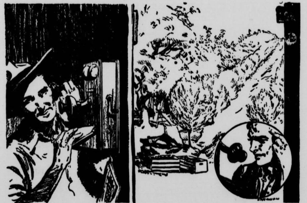
LES CANADIENS ET LEURS INDUSTRIES — ET LEUR BANQUE