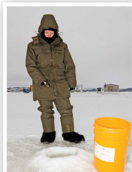
La limite de prise journalière d'éperlan arc-en-ciel est de 120.