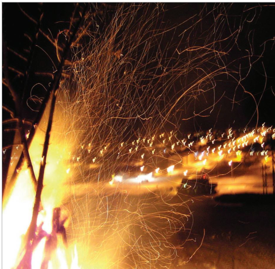
Un feu de joie au dieu de la neige Ullr a été allumée afin de réclamer le retour de la poudreuse au mont Miller.