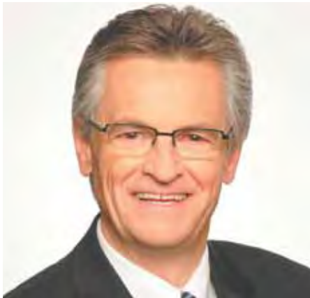
Gilles Deguire, maire de l'arrondissement