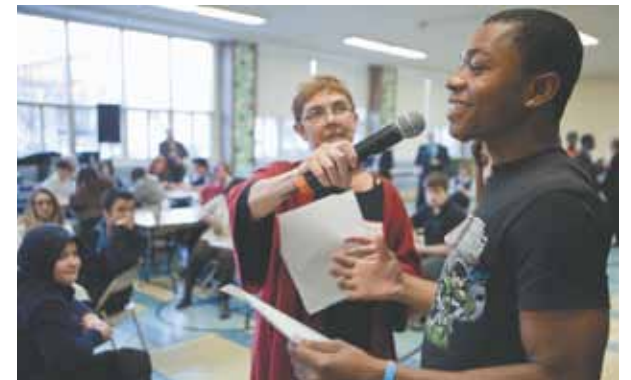
Au moment de la plénière du Forum jeunesse du 10 novembre dernier.

En prenant part à des ateliers qui faisaient appel à leur créativité, près de 80 jeunes ont transmis leurs idées de projets en vue d'améliorer la relation qu'ils entretiennent avec leur environnement tant physique que social. Les thèmes abordés passaient de l'implication sociale des jeunes dans la communauté à leur perception de l'arrondissement, en passant par les solutions pour vivre en harmonie avec la diversité culturelle ainsi que les moyens d'améliorer les relations avec l'autorité.