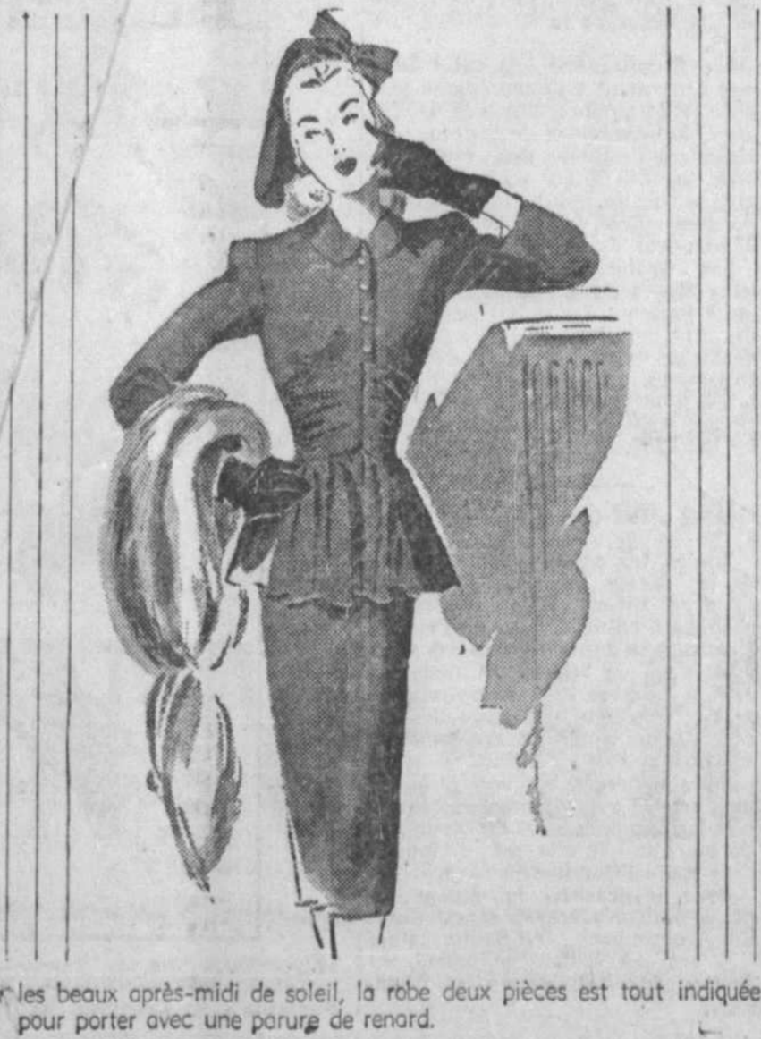
Par les beaux après-midi de soleil, la robe deux pièces est tout indiquée pour porter avec une parure de renard.

La visiteuse — Madam est-elle là? La bonne — Oui, madam, entrez. La visiteuse — Ce n'est pas trop tôt! Habituellement, que fois que je veux lui présenter ma note, elle est sortie!... La bonne — Oui, ma aujourd'hui elle vient de me con-dier.