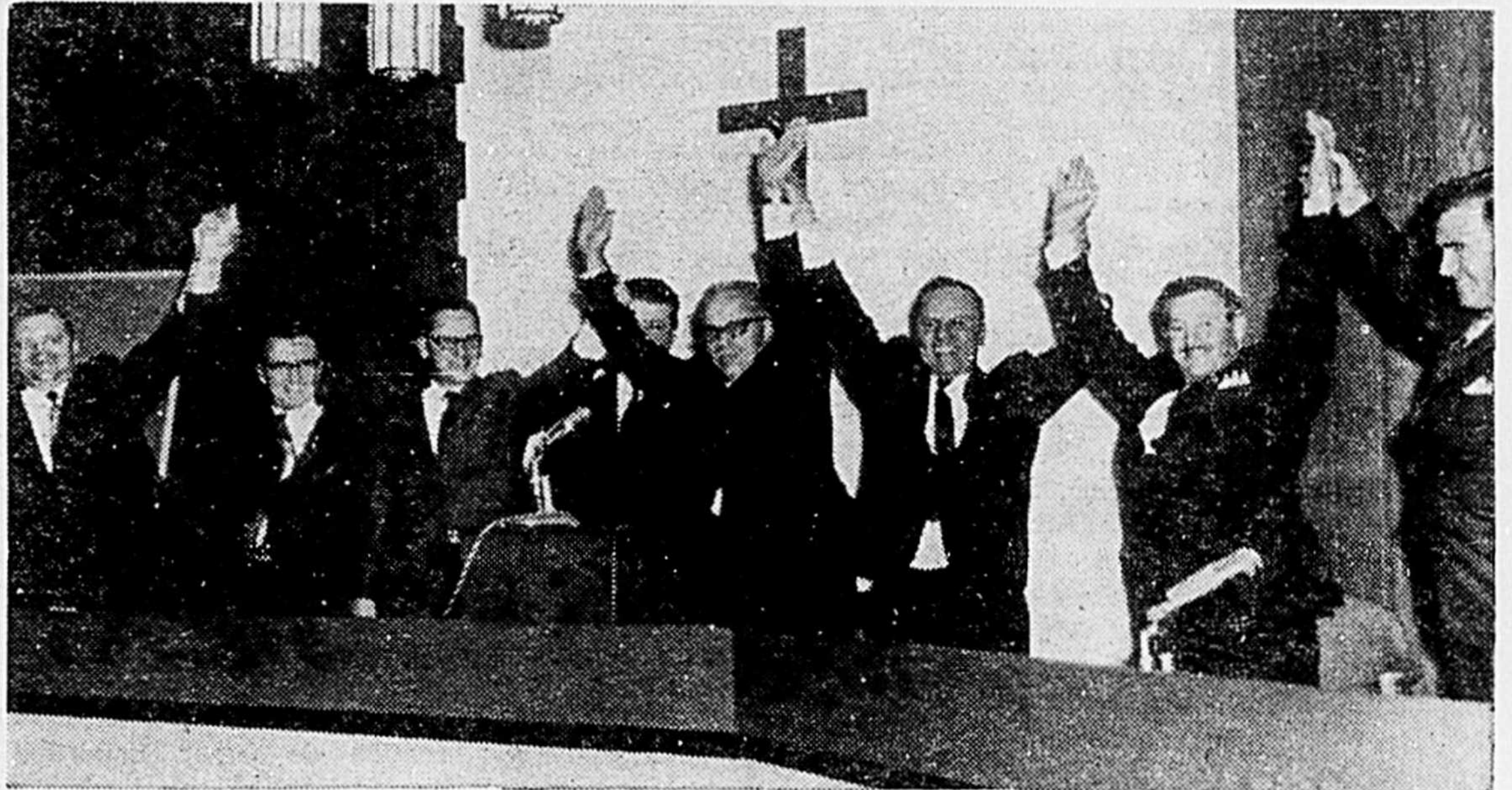
Le cri de la victoire — A l'hôtel de ville de l'Épiphanie, après la victoire de toute son équipe, le maire et les conseillers élus saluent la foule de leurs partisans qui les acclame. Dans l'ordre: