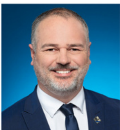
JONATAN JULIEN Député de Charlesbourg

Cette fonction est très simple d'utilisation; il suffit de cliquer sur le bouton désigné à cet effet dans l'interface de l'appel vidéo et de sélectionner la langue que vous souhaitez utiliser pour le sous-titrage. Google se charge du reste, c'est-à-dire de transcrire instantanément et même de traduire la conversation si les personnes présentes à la rencontre ne parlent pas toutes la même langue. Lancée d'abord en Europe, cette technologie sera disponible sous peu en français au Québec. L'arrivée de la transcription instantanée pourra changer votre manière de communiquer avec vos proches et vos collègues, en plus de faciliter la prise de rendez-vous et autre. La bonne nouvelle ne s'arrête pas ici ! Cette innovation sera également rendue disponible sur les téléphones Google Pixel 4 et Google Pixel 5. Ces téléphones intelligents disposent d'une application qui s'appuie sur la même technologie et qui permet de transcrire instantanément les appels téléphoniques sur l'écran de votre téléphone. Actuellement offerte uniquement en anglais, l'application en français sera disponible dans les mois à venir.