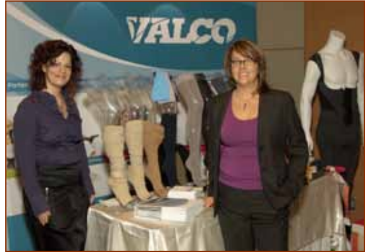
► Produits Valco, Commanditaire PARTENAIRE