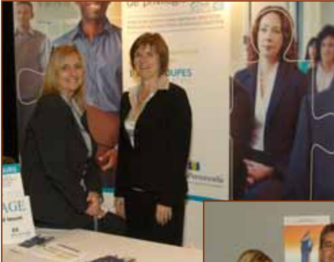
▼ La Personnelle Assurances générales, Commanditaire PARTENAIRE