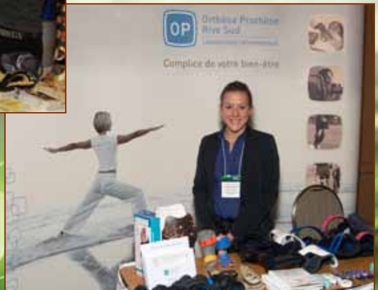
▼ Orthèse Prothèse Rive-Sud, Commanditaire PARTENAIRE