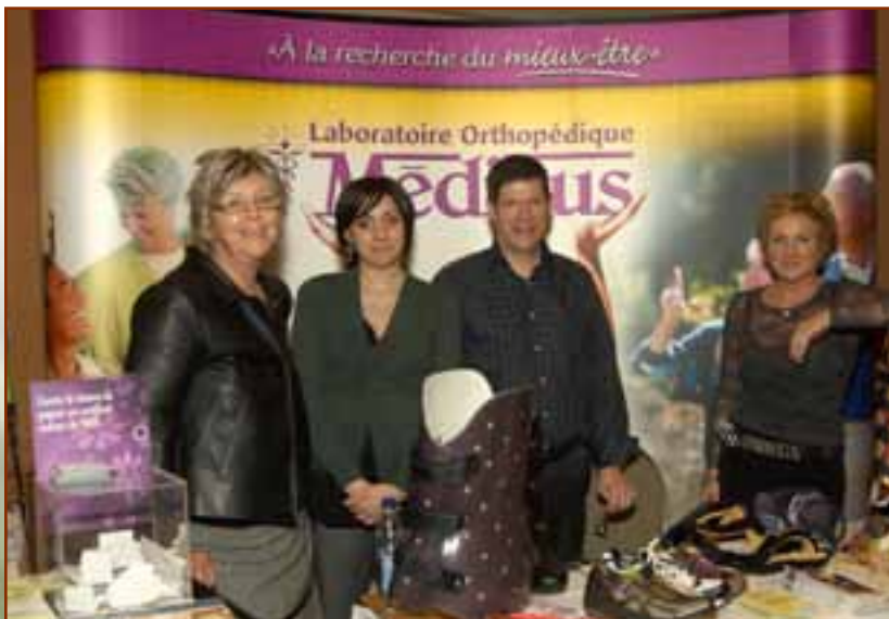
◄ Médicus, Commanditaire PARTENAIRE