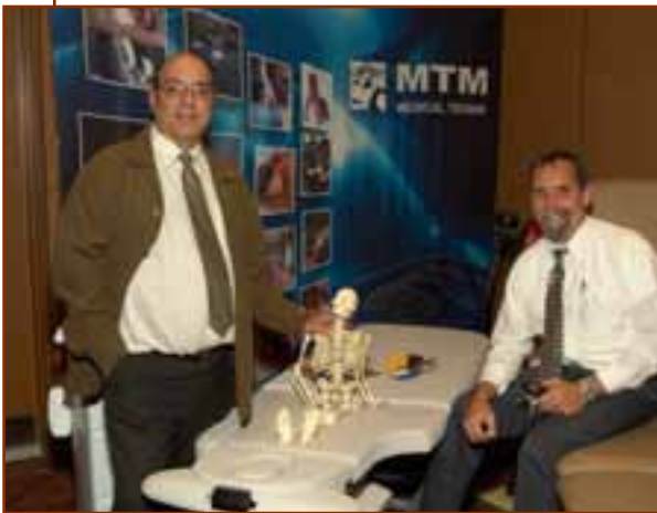
▲ MTM Médical Tronik, Commanditaire PARTENAIRE