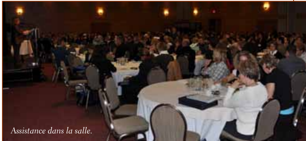
Assistance dans la salle.