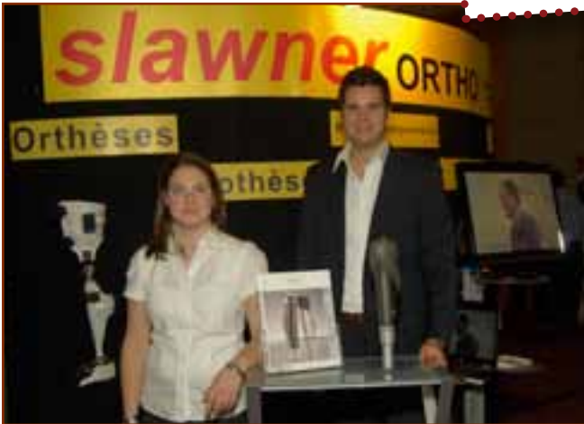
► Laboratoire J, Slawner Ltée, Commanditaire MAJEUR et COCKTAIL