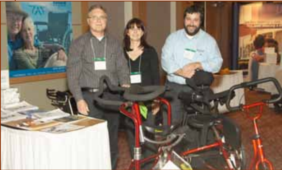
► Savard Ortho Confort, Commanditaire PARTENAIRE