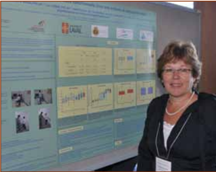
► Séance d'affichage, M me Joanne Saulnier, pht.