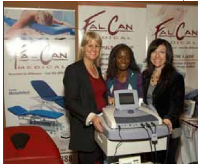
► Falcan Médical, Commanditaire PARTENAIRE