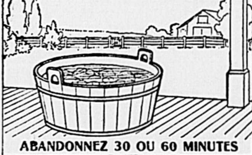
ABANDONNEZ 30 OU 60 MINUTES

Frottement dur et ébullition—deux opérations qui appartiennent à l'histoire ancienne dans les ménages où on se sert du Sunlight Savon d'après les directions.