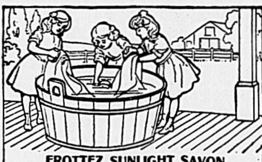
FROTTEZ SUNLIGHT SAVON

Le Sunlight Savon est supérieur aux autres savons, mais c'est lorsqu'il est employé suivant la méthode Sunlight qu'il démontre sa plus grande supériorité. (Suivez les directions.)