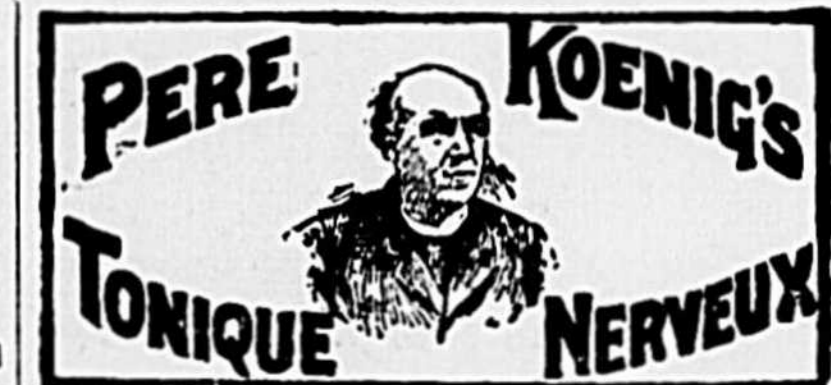
Le meilleur remède au monde. 10

Je considère le Tonic du Péré Koenig pour les Nerfs comme le meilleur remède au monde. J'ai souffert d'un catarrhe et de faiblesse de nerfs. J'ai été littéralement guéri par ce remède, et je donne ce témoignage afin que d'autres pauvres affligés puissent bénéficier de mon expérience. J'étais malade depuis quatre ans et je recommande le Tonic à tous. Wm. J. CULLAN. M. J. Larose, de St-Roch de l'Acadian, Can., écrit : Je souffrais d'attaques épileptiques quand on me conseilla de faire usage du Tonic du Péré Koenig pour les Nerfs. Après la troisième bouteille je constatai à mon grand étonnement que toutes traces du mal étaient complètement disparues, et que je ne pouvais craindre une rechute. Mes amis et mes voisins ne croyaient condamné pour la vie à être l'esclave de cette terrible maladie. Je me fais un devoir de dire que ma guérison, a été merveilleuse, et qu'elle est due à l'emploi de votre Tonic. Je le recommande donc très favorablement.