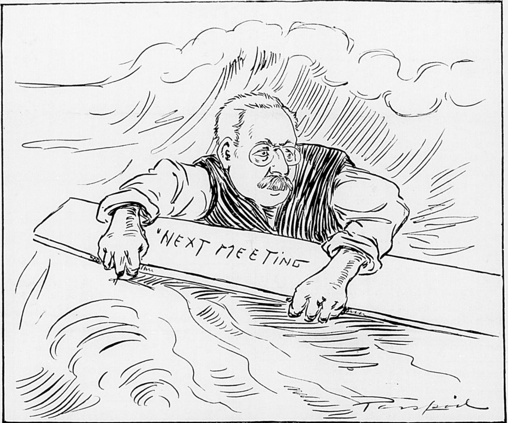
CARTER. — Cré nom ! que ce rivage est loin !

NOS DEVINETTES-ILLUSTREES ET NOS CHARADES VOUS PERMETTENT DE VOUS ABONNER AU "CANARD" POUR MOITIE PRIX