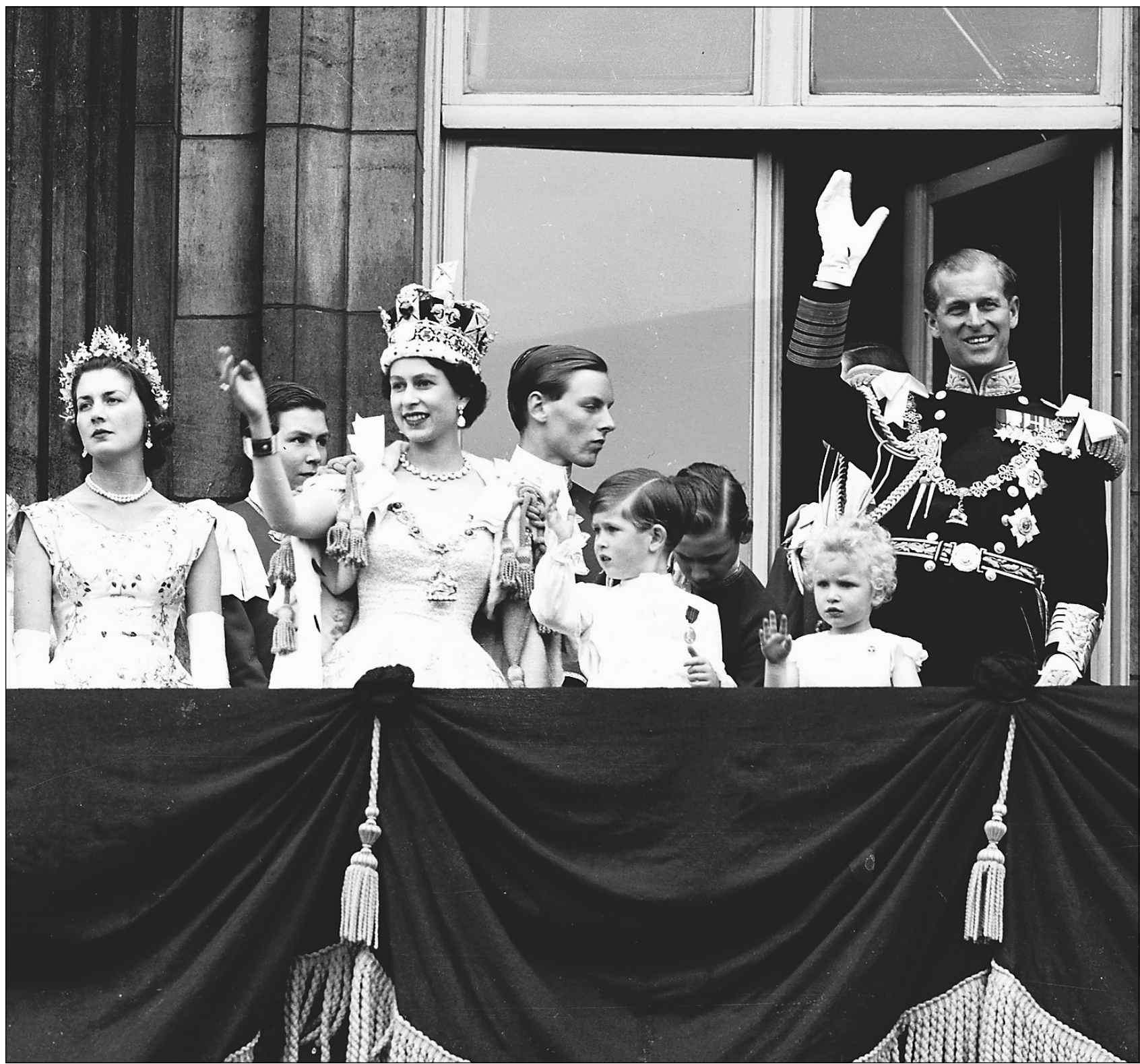
Juin 1953. Élisabeth II vient d'être couronnée et la famille royale salue la foule du balcon du palais de Buckingham. Sur cette photo, on aperçoit entre autres le prince Charles, à droite de la reine.