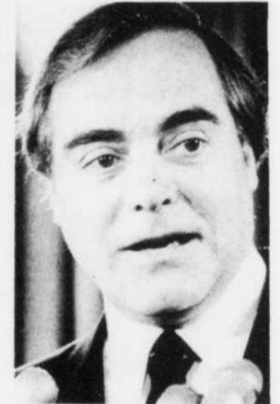
Le ministre de l'Énergie, des Mines et des Ressources, M. Marcel Masse

dial, nous devrions au contraire prêcher et plaider par l'exemple en utilisant l'amiante dans une foule de produits de manière à ce que l'on puisse affirmer à tous les éventuels et potentiels clients que nous utilisons cette richesse naturelle avec la ferme conviction qu'il est indispensable dans une foule de secteurs. Qu'il me soit simplement permis de vous donner à titre d'exemple, les garnitures de freins pour automobiles. Dans un avenir prochain, je suis convaincu que les