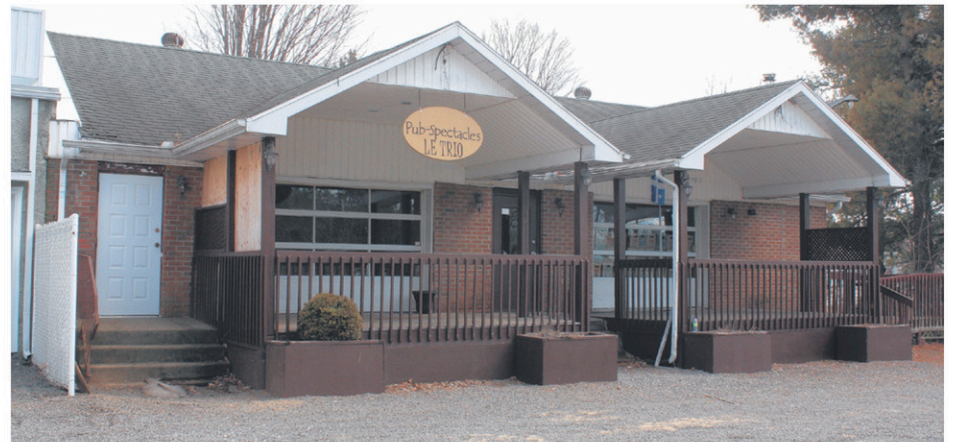
Le conseil municipal étudie la possibilité de transformer cet établissement en maison de jeunes.

«On a beaucoup de jeunes et on en aura encore plus dans les prochaines années. Cette maison de jeunes serait située près de notre parc des loisirs et les jeunes pourraient utiliser nos installations sportives puis retourner facilement à cet endroit. Il faut avoir une vision à long terme. Lors des prochaines années, les jeunes seront plus nombreux et je pense que cet endroit de rassemblement serait bien pour eux. C'est bien mieux avoir ça que de les voir traîner dans les rues», indiquait M. Landry.