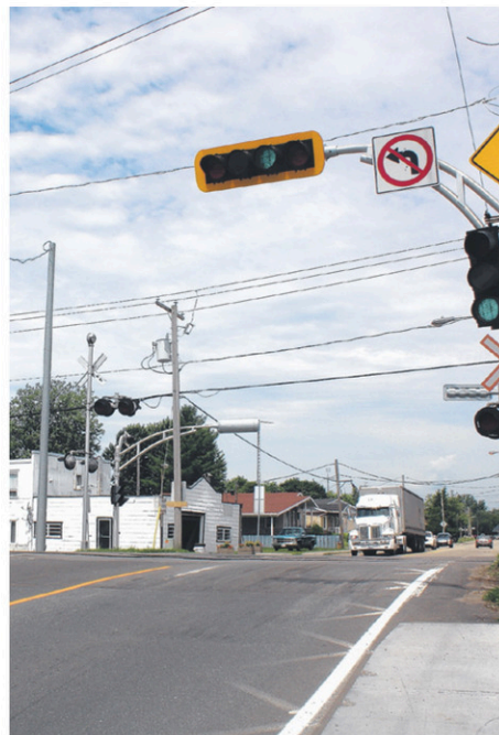
Le virage à gauche y est interdit depuis presque un an.

Du 31 août au 2 octobre 2015, le ministère des Transports du Québec a procédé au réaménagement de l'intersection de la route 138 et de la route 348 à Louiseville. Ces travaux comprenaient le remplacement des feux de circulation, l'asphaltage de la chaussée et la reconstruction des trottoirs situés à proximité de cette intersection. «La configuration de l'intersection demeure la même, mais la gestion de la circulation sera différente», rapportait à TC Media