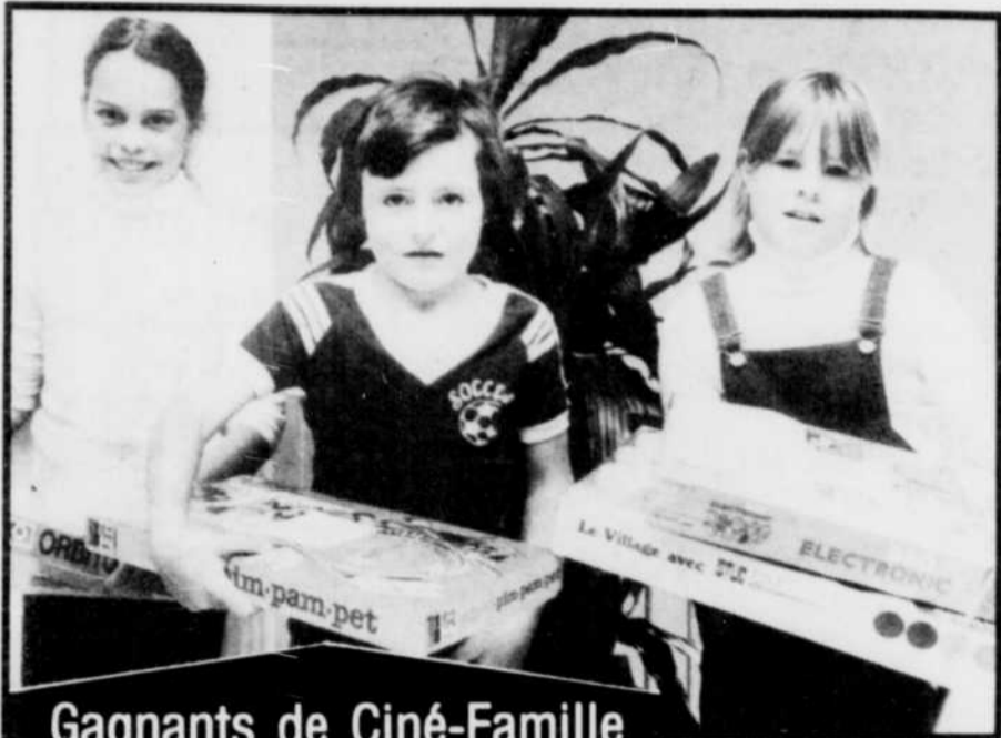
Gagnants de Ciné-Famille

natale des "Beatles" et les jeunes, comme les moins jeunes d'ailleurs, de cette triste ville industrielle actuellement en pleine crise, sont fiers de cette célébrité. On s'attend donc que le spectacle obtienne un triomphe.