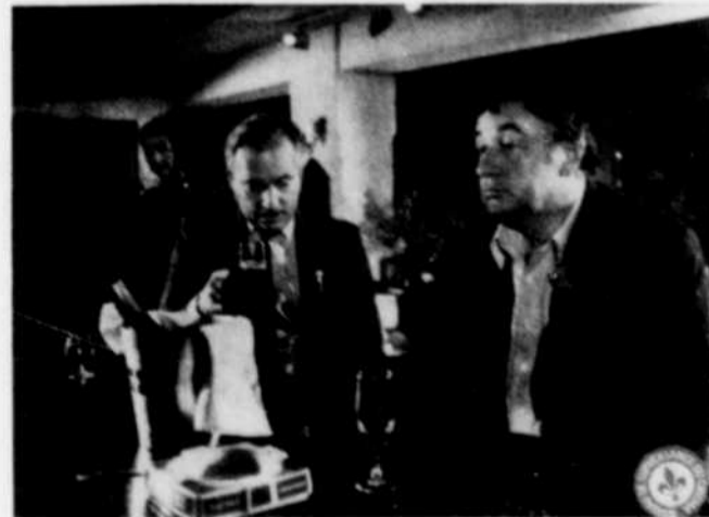
Michel Serrault et Philippe Noiret dans Pile ou Face de Robert Enrico

Un drame policier français (1980), de Robert Enrico, avec Philippe Noiret et Michel Serrault. Représentations: 19h30 et 21h30.