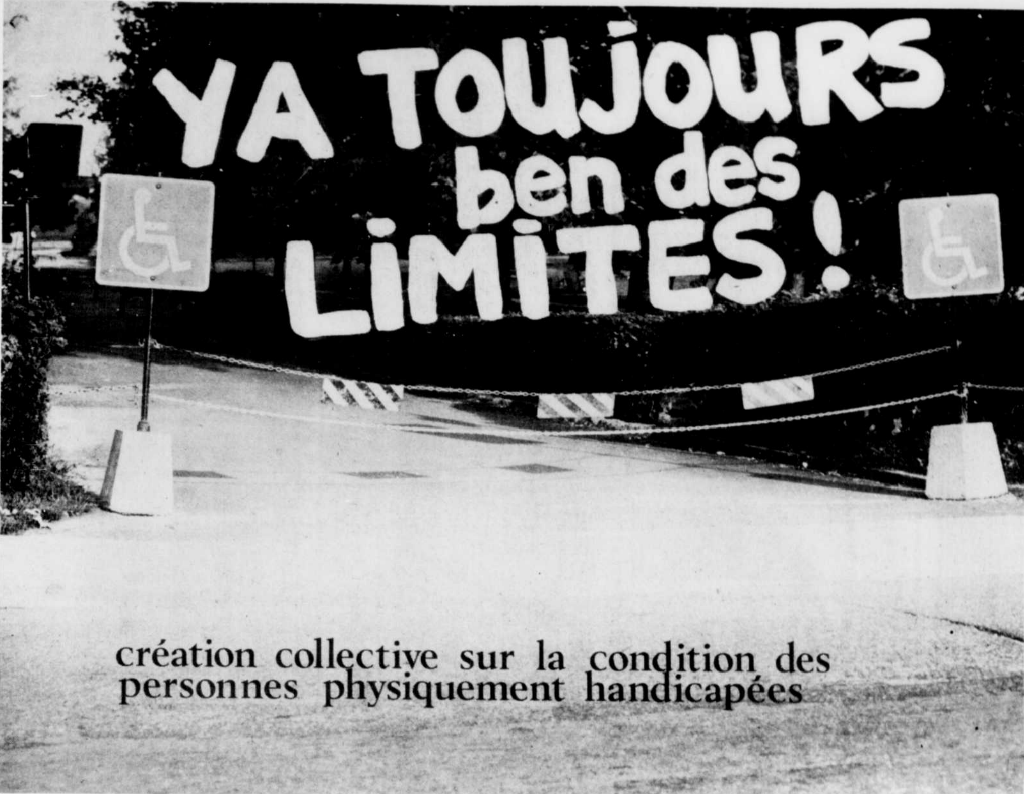
création collective sur la condition des personnes physiquement handicapées

Petite Salle Mercredi 14, jeudi 15 et vendredi 16 octobre YA TOUJOURS BEN DES LIMITES