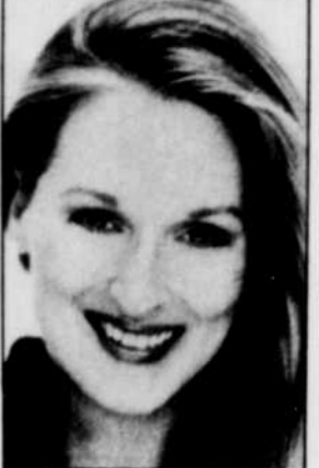
Meryl Streep... la mystérieuse

Night, Sunday Morning") étaient en effet confrontés à un problème épineux. Les passions décrites par Fowles, son analyse de l'entourage du couple Sarah-Charles sont foncièrement celles d'un écrivain du 20ème siècle.