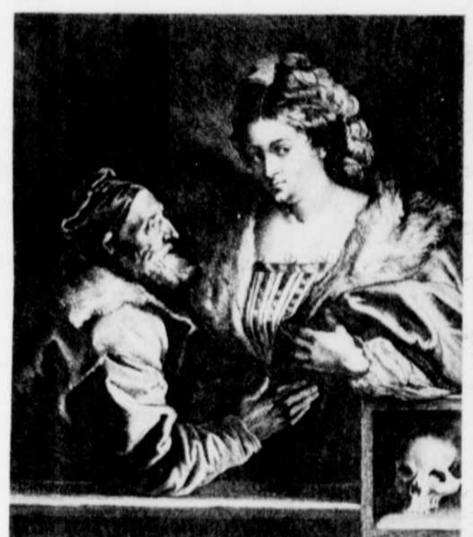
Le Titien et la courtisane d'après un tableau de Titien. Gravé à l'eau-forte par Van Dyck et au burin par Luc Vosterman. 4e état. 30,6 x 23,5 cm.

Les estampes qui forment cette série sont fascinantes du point de vue artistique et du point de vue historique. Ensemble, elles donnent un aperçu inestimable de la pratique de l'art au dix-septième siècle et mettent en lumière l'esprit de l'époque où Van Dyck a travaillé et vécu. Soixante-sept des cent planches originales font partie de la présente exposition qui provient de la collection de la Galerie nationale du Canada.