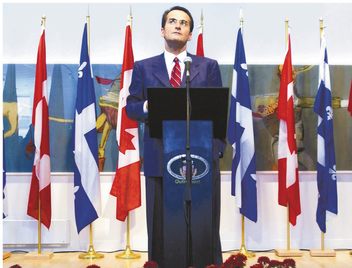
Février 2004. Jean Lapierre annonce son retour au sein du Parti libéral du Canada.