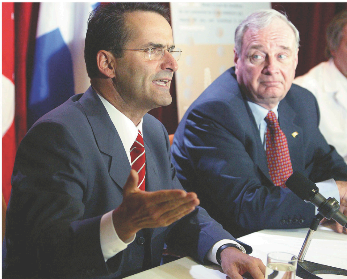
Jean Lapierre fera un retour en politique fédérale active en 2004 lorsque Paul Martin est élu chef du Parti libéral du Canada.

Le 23 juin 1990, jour de la mort officielle de l'accord, Jean Chrétien est élu chef du PLC à Calgary. Il est embrassé par Clyde Wells, le premier ministre de Terre-Neuve qui a refusé de soumettre l'accord à un vote et qui incarne aux yeux des Québécois son fossyeur.