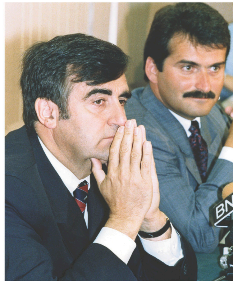
Lucien Bouchard écoute Jean Lapierre, alors membre du Bloc québécois, parler aux médias, en septembre 1990 à Montréal.

Gilles Duceppe abonde. « Il était souverainiste. Il était un peu comme les Québécois: ça change selon le contexte. C'est ce qui s'est passé. »