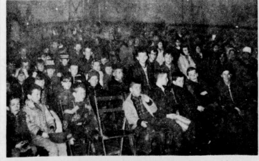
QUE FERONT CES JEUNES...? — Sous les auspices du Club des adolescents, des représentations cinématographiques sont présentées à tous les samedis, depuis un mois, à l'intention des jeunes de St-Maurice de Thetford. Avec la fermeture définitive de la salle paroissiale, vendredi prochain, on se demande comment ces jeunes, au nombre de quelque 150, employeront maintenant cet après-midi de congé?