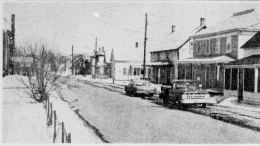
ELLES SERONT DEMOLIES — Cette photo donne une idée du secteur de la rue St-Pierre, à Coaticook, dont la Commission scolaire de l'endroit se portera acquéreur, d'ici quelque temps afin d'agrandir les terrains de la commission et de construire une nouvelle école primaire, pour remplacer l'école Sacré-Coeur, dont on voit une partie, à gauche de la photo.