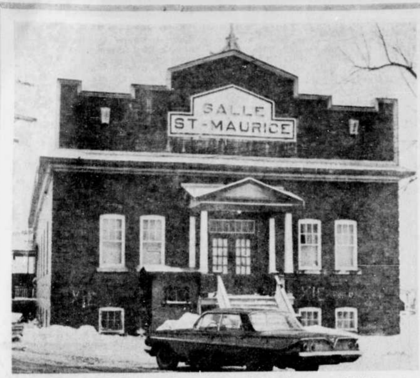
FERMEE LE 1er AVRIL — La salle paroissiale St-Maurice sera définitivement fermée vendredi prochain, le 1er avril. Ce ne sera point un "poisson d'avril", mais la triste réalité, hélas. On espère ferme qu'on trouvera un autre local pour mettre à la disposition des mouvements paroissiaux et de loisirs.

THETFORD MINES, (BF) — Il est possible que le congrès régional annuel des Chambres de commerce de la région de l'amiante du Haut-St-François se tienne à Thetford Mines. Ce serait la première fois que la cité de l'amiante serait le site de telles assises. Le projet sera discuté plus longuement le 4 avril prochain à l'occasion d'une importante rencontre qui se déroulera au local de la Chambre locale. Sont attendus pour la circonstance des représentants de la Chambre provinciale de commerce que de la régionale de l'amiante du Haut-St-François. Ce congrès réunirait les membres des Chambres de Lac-Mégantic, East-Angus, East-Ferdinand, Thetford Mines, St-Ferdinand d'Halifax, East-Broughton Station, et Thetford Mines. But principal Le but principal de la réunion est d'étudier la possibilité d'implanter de nouvelles Chambres au sein du territoire de la régionale du Haut-St-François.