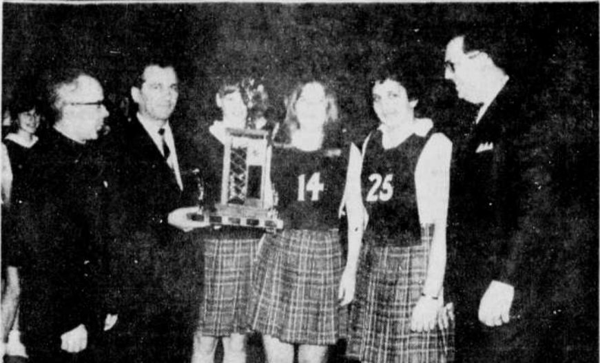
BALLON-PANIER — Le collège St-Bernard et le collège Marie de la Présentation ont remporté les grands honneurs des compétitions de ballon-panier organisées au niveau des écoles secondaires de la cité de Drummondville. Les autorités municipales et les personnes chargées de l'éducation physique à la régionale remettent ici les trophées aux vainqueurs de chacune des catégories.