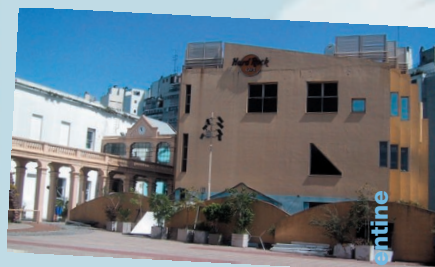
L'immeuble de Buenos Aires où sont reçus les participants québécois du programme Québec-Argentine.