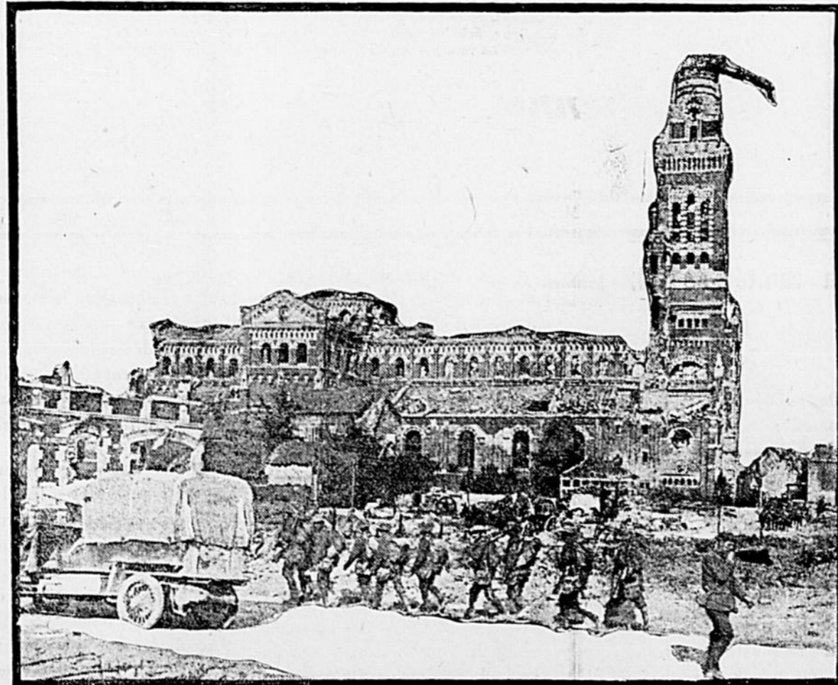
Soldats anglais défilant devant la cathédrale d'Albert, dévastée par les obus allemands dès les premières semaines de la guerre en 1914.